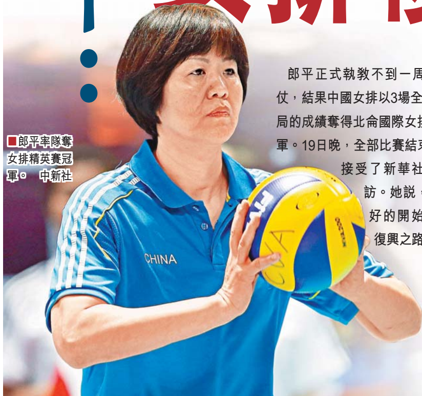
郎平率隊奪得北命國際女排精英賽冠軍。

郎平正式執教不到一周即迎來首冠，結果中國女排以3場全勝、僅失1局的成績奪得北命國際女排精英賽冠軍。19日晚，全部比賽結束後，郎平接受了新華社記者的專訪。她說，這是一個好的開始，但女排復興之路漫漫。