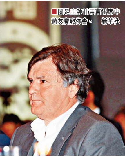
國足主帥甘馬曹出席中荷友誼賽發佈會。

中國足球隊主教練甘馬曹20日在與荷蘭隊友誼賽前的新聞發佈會上表示，國足已取得一些進步，希望能夠在對陣荷蘭隊的比賽中取得好的結果，並好好跟「世界足球的標杆」學習。