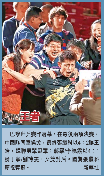
巴黎世乒賽昨落幕。在最後兩項決賽，中國隊同室操戈，最終張繼科以4:2勝王皓，蟬聯男單冠軍；郭躍/李曉霞以4:1勝丁寧/劉詩雯，女雙封后。圖為張繼科慶祝奪冠。

談起男雙決賽，馬琳說：「我覺得比賽輸贏比較正常，因為對手具有很高水準，以前也沒怎麼和他們打過，感覺會有一些生疏。今天我們在前三板和接發球上有些混亂，造成技戰術上的被動。」 香港文匯報記者 陳曉莉