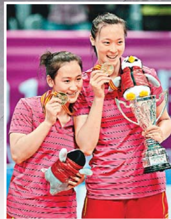
惠若琪(右)手捧獎盃與隊友合影。