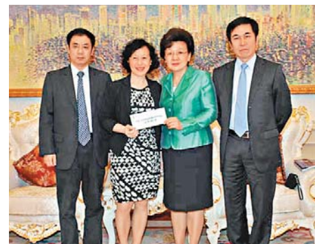
華懋集團向蘆山地震災區捐款300萬港元。