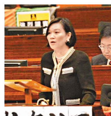
梁美芬批評反對派議員以拉布要求改善服務，是「無補於事、本末倒置」。