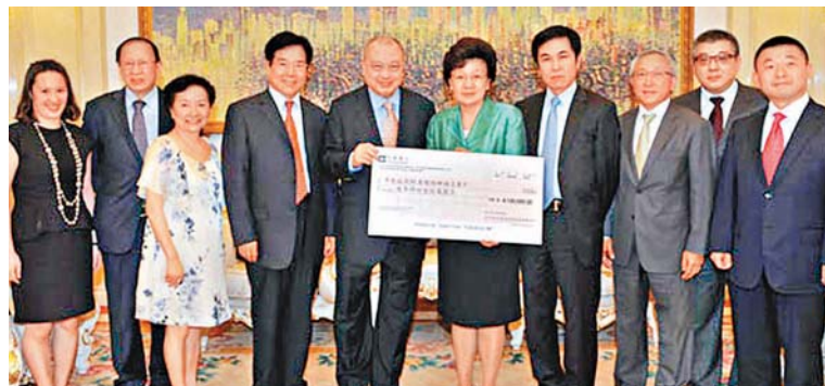
四川省各級政協港區委員聯誼會向蘆山地震災區捐款410萬港元。

中聯辦已成立賑災專戶：(中文名稱：中央政府駐港聯絡辦賑災專戶；英文名稱：LIAISON OFFICE OF THE CPG IN THE HKSAR—SPECIAL A/C FOR DISASTER RELIEF)；賬戶號碼：01287500193328；開戶銀行：中國銀行(香港)有限公司；聯繫地址：香港干諾道西160號2113室(2113, 21/F 160 CONNAUGHT ROAD WEST, H.K.)；聯繫電話：28314333轉賑災辦。