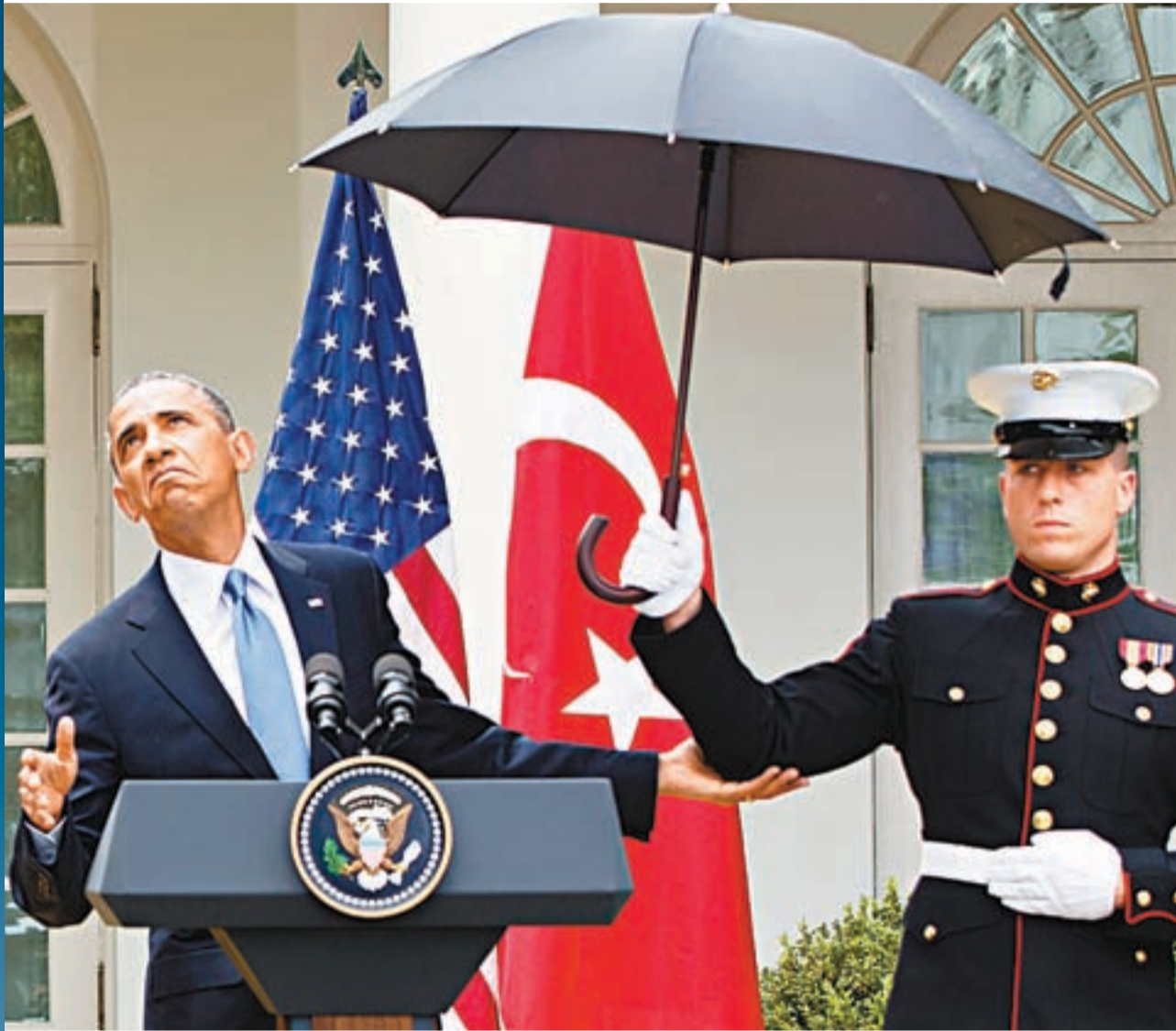
■奧巴馬要身穿制服的海軍陸戰隊員代為撐傘，備受外界揶揄。