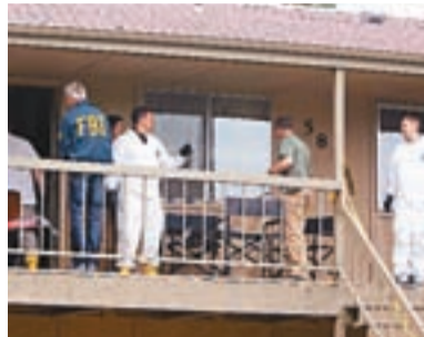
■美聯探員在庫爾班諾夫的住所搜證。