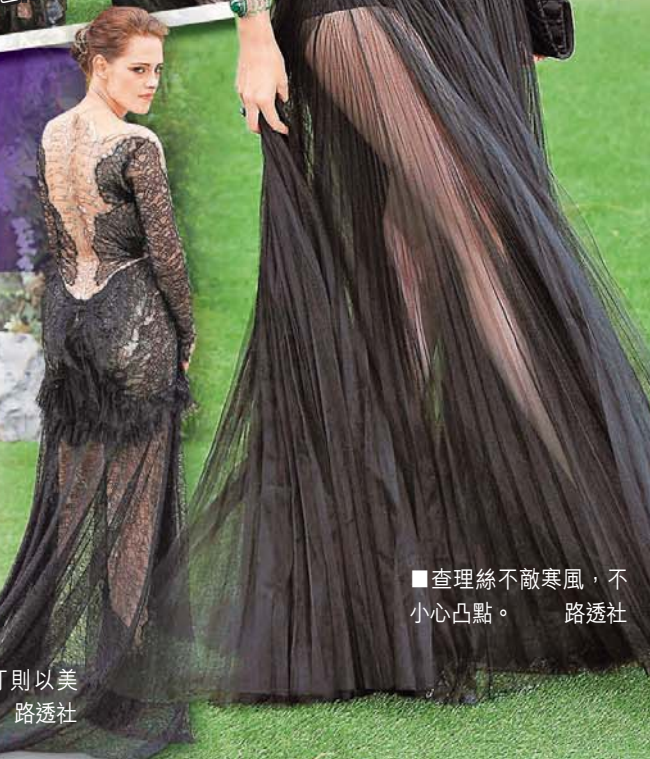
查理絲不敵寒風，不小心凸點。