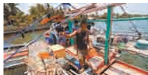
菲律宾外交部14日发表声明透露,菲律宾政府也将发布休渔令。图为菲律宾渔船。

另据报道,新任广东省委常委、广东省军区政委黄善春表示,黄岩岛自古以来就是中国的领土,不管菲律宾搞什么动作,不管是拉拢哪些国家来参与,都改变不了黄岩岛是中国国家领土的一个根本的事实。他表示,“请我们的群众、网民们相信,我们的中央、我们的军队完全有能力、有决心守卫好黄岩岛。”