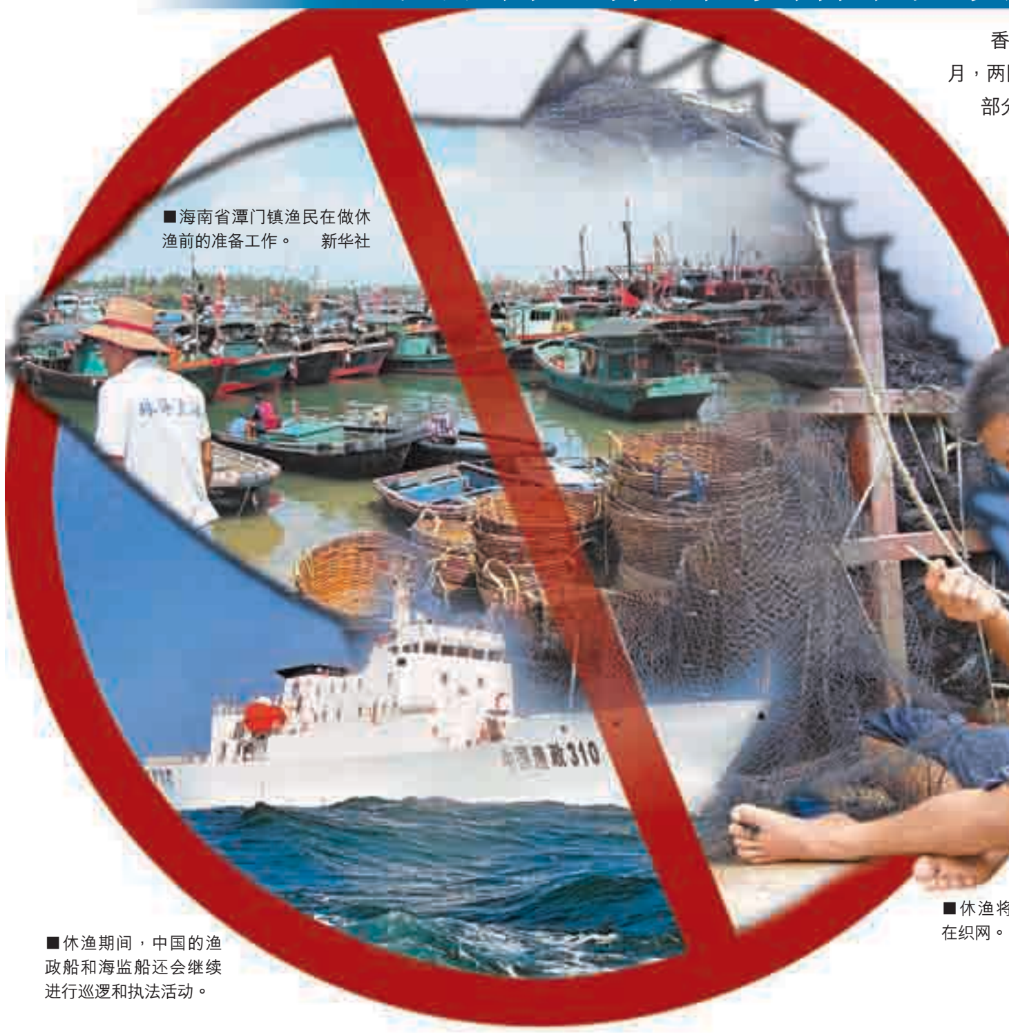
海南省潭门镇渔民在做休渔前的准备工作。