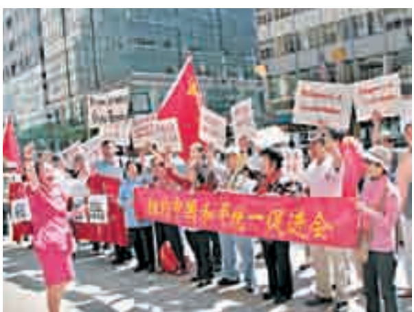
华人在菲律宾驻美大使馆前举行示威活动。

菲律宾驻美国大使馆位于华盛顿马萨诸塞街1600号。自13日上午10时至11时30分,美国华人在菲律宾驻美使馆前举行示威活动。示威者手持写有“菲律宾立即撤出黄岩岛”、“黄岩岛是中国固有领土”、“黄岩岛是我们的”等大幅标语,呼喊“黄岩岛属于中国”等口号,表达对菲律宾政府南海问题立场的抗议。