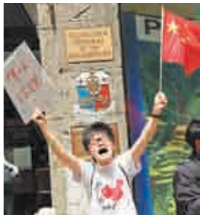
在美华人高呼口号,就黄岩岛事件向菲律宾方面表达抗议。

香港文汇报讯 据人民网报道,美国华人于当地时间13日上午在菲律宾驻美国大使馆前举行示威活动,宣示坚决支持中国维护黄岩岛主权,严正警告菲律宾侵权蛮行。