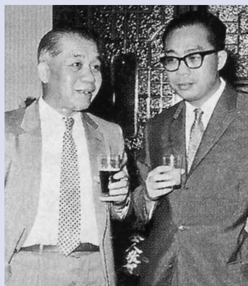
■ 恒生银行创办人何善衡(左)与利国伟

踏入二十一世纪，金银业贸易场亦与时俱进，建立电子交易平台，为行员业务发展带来便利，得以取得高速增长。同时，又积极加强与内地交流，协助行员掌握来自内地市场的庞大商机，并拟推出以人民币报价的公斤条，迎合内地市场。金银业贸易场至今仍保留传统营运模式，继续为香港金融业作出贡献，实属难能可贵并足以自豪。