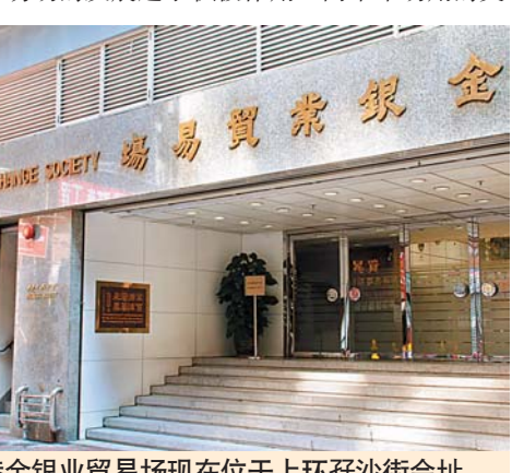
■ 香港金银业贸易场现在位于上环孖沙街街址

香港伦敦金市场的发展对促进金银业贸易场的发展起了积极作用，两个市场用的交易单位、定价货币、金条成色、利息支付制度均有不同，但并行营运，进一步推动香港黄金市场发展。上世纪80年代初，香港黄金成交量已超过苏黎世，与伦敦、纽约并称为世界四大黄金市场。