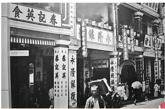
■ 香港金银业贸易场与香港银行业渊源深厚。图为1930年中环皇后大道中，永隆银行前身永隆银号。

可惜的是，“金银业行”所有纪录都在1918年第一次世界大战期间散失，其行员数目等都不得而知。在香港政府华民政务司夏德里的面下，“金银业行”于1920年注册成为“金银业贸易场”（The Chinese Gold & Silver Exchange Society），并草拟法规，重新登记行员逾200家，会员以店号为单位，持牌者为当时的司理人，故会员亦称“行员”。