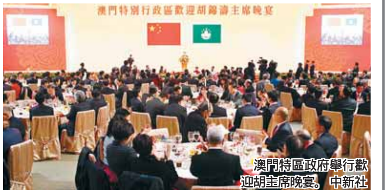
澳門特區政府舉行歡迎胡主席晚宴。

另外，澳門特區政府高度重視與會嘉賓的安全。以記者入場時為例，須經過2次安檢程序，分別接受X光機與人手檢查隨身物件，才可進入歡迎晚宴的現場。而在進入會場後，如果記者欲前往洗手間，亦要由在場工作人員陪同帶領，全方位做好照顧記者與安保的工作。