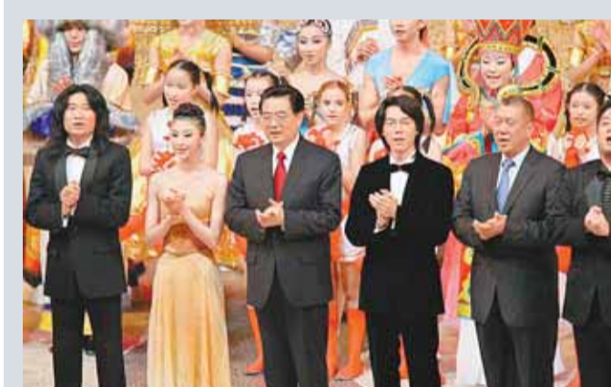
澳門舉行盛大文藝晚會，胡錦濤與全場同唱《歌唱祖國》，將晚會帶入高潮。 中新社

【五星紅旗迎風飄揚，勝利歌聲多麼嘹亮；歌唱我們親愛的祖國，從今走向繁榮富強……】在慶祝澳門回歸的「重頭戲」之一「慶祝澳門回歸祖國10周年文藝晚會」上，國家主席胡錦濤在晚會的最後，與澳門特首何厚鏌一起，帶領全場高歌《歌唱祖國》，將澳門各界慶祝回歸10周年活動的氣氛推向高潮。