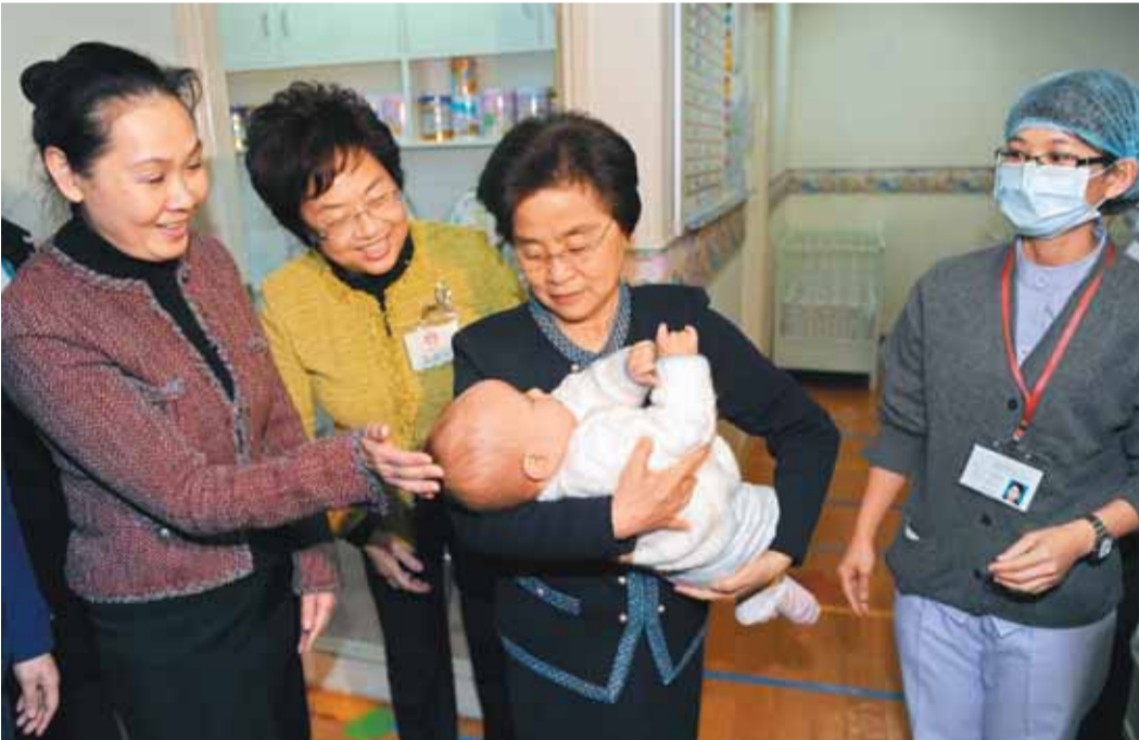
國家主席胡錦濤夫人劉永清，在澳門特首何厚鏌夫人劉涓楨（左一）陪同下，參觀訪問澳門母親會所屬聖約翰托兒所，並抱起一名嬰兒。

【本報記者徐海煒、郭曉樂澳門報導】在國家主席胡錦濤忙於各項官式活動之際，胡錦濤夫人劉永清在何厚鏌夫人劉涓楨陪同下，專程到位於澳門波爾圖街的母親會聖約翰托兒所，探訪了該園的嬰兒房、入學前兒童教室，並興致勃勃地觀看了孩子們表演的舞台劇和歌舞。看到小朋友天真爛漫的樣子，劉永清誇獎他們表演得真精彩，並高興地同小朋友們合影留念。她說，澳門在發展慈善公益事業方面有不少成功經驗，值得大陸學習借鑑，並希望今後大陸和澳門就發展慈善公益事業加強交流合作。