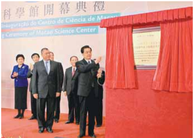
國家主席胡錦濤出席澳門科學館開幕典禮，並為科學館揭幕。 新華社

【本報記者郭曉樂、徐海煒 駐澳門記者王海濤 報導】投資3.37億元、歷時3年興建的澳門科學館，於19日下午舉行隆重開幕禮，國家主席胡錦濤與澳門特區行政長官何厚鏌共同主持了開幕儀式。胡錦濤在參觀科學館期間，和澳門的少年兒童一起探索科學的奧秘，並勉勵這些熱愛科學的小學生說：「你們是國家的希望和未來，希望你們從小愛科學、學科學、用科學，長大以後成為創新型人才，為澳門、為國家服務。」