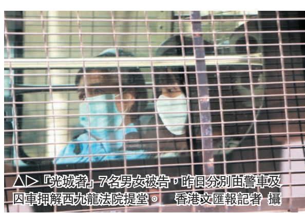
△「光城者」7名男女被告，昨日分別由警車及囚車押解西九龍法院提堂。