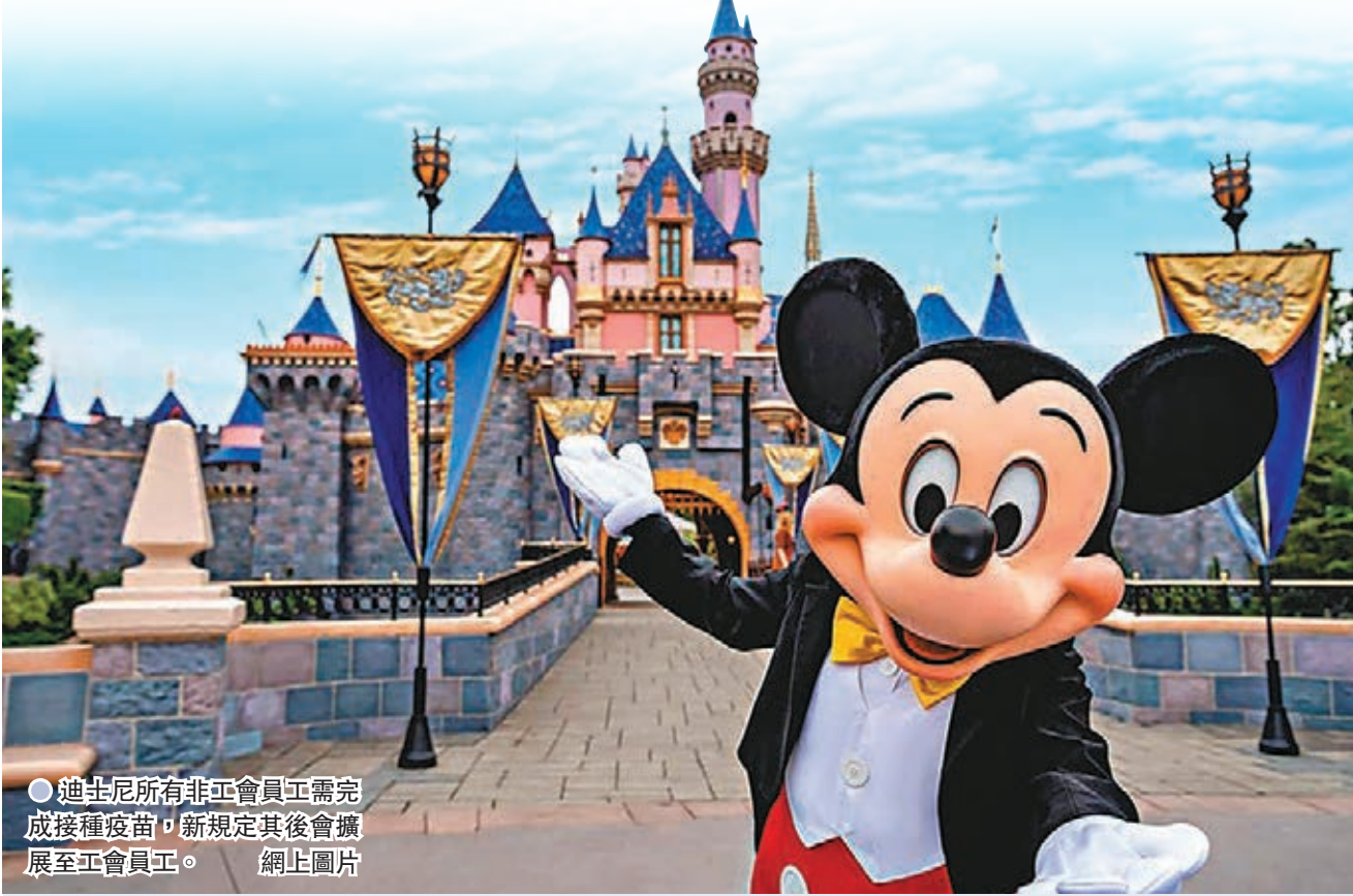
●迪士尼所有非工會員工需完成接種疫苗，新規定其後會擴展至工會員工。