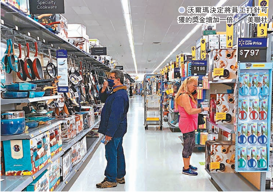
●沃爾瑪決定將員工打針可獲的獎金增加一倍。

美國總統拜登上周四宣布，將要求所有聯邦政府僱員接種新冠疫苗，否則便需定期接受病毒檢測，全美不少企業亦已陸續推出類似要求。部分醫學專家相信，華府要求公務員打針可設下先例，有助私人企業參考措施細節安排跟隨，最終或令員工需接種疫苗成為趨勢，有助提升接種率。