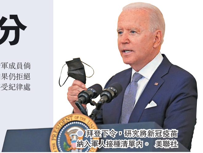
●拜登下令，研究將新冠疫苗納入軍人接種清單內。