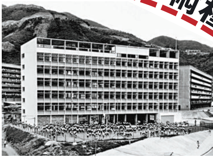
●林群聲小時就讀位於柴灣徙置區的柴灣官立小學。學校於1980年已停辦。

很多人都相信「名師出高徒」，但對於公大校長林群聲而言，在學業上最能啟發他的，卻是幾個平凡而默默耕耘的老師，包括小學的一位英文老師；任教中學數學、總是帶備糖果獎勵學生的和藹神父；在大學尚未「上位」的年輕講師。他們在林群聲不同的求學階段中給予指引及鼓勵，為小伙子日後的學術道路埋下種子。從小到大都是尖子的林群聲，現時的學術成就或已超越老師，但幾十年後，他依然記住恩師們的啟迪，並在近日舉行的公大校長就職典禮上，公開感謝他們。他之後接受香港文匯報訪問時亦坦言，「我一生都非常幸運，能夠遇到好老師。」