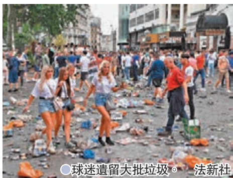
●球迷遺留大批垃圾。