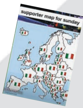
●歐洲大量網民早在賽前不齒英格蘭球迷在歐國盃的表現，紛紛支持意大利。