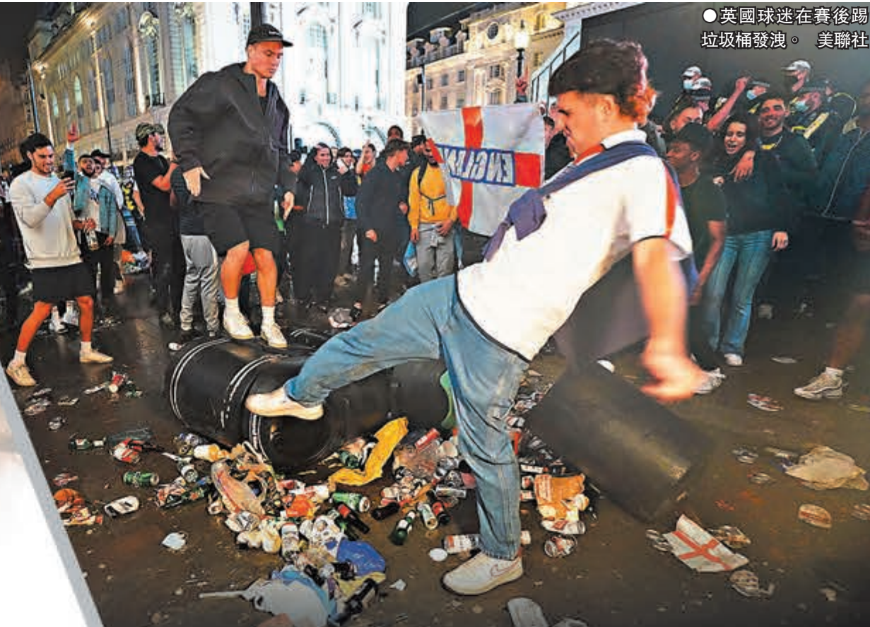
●英國球迷在賽後踢垃圾桶發洩。