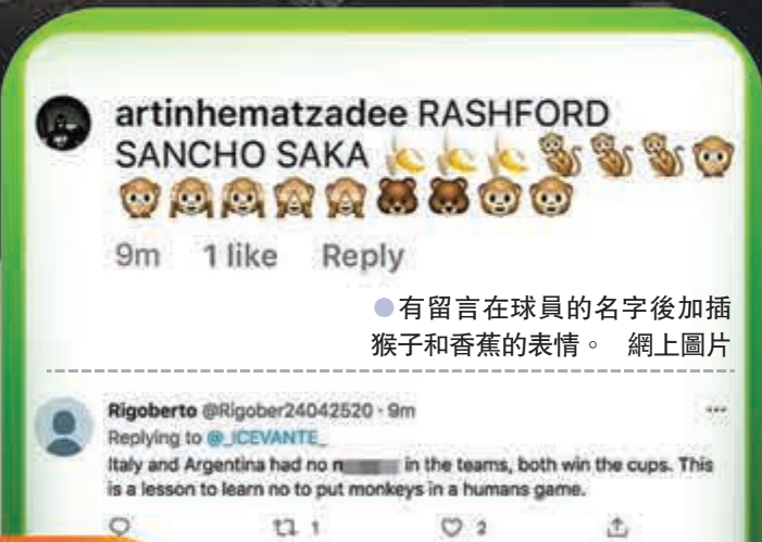
●有留言在球員的名字後加插猴子和香蕉的表情。