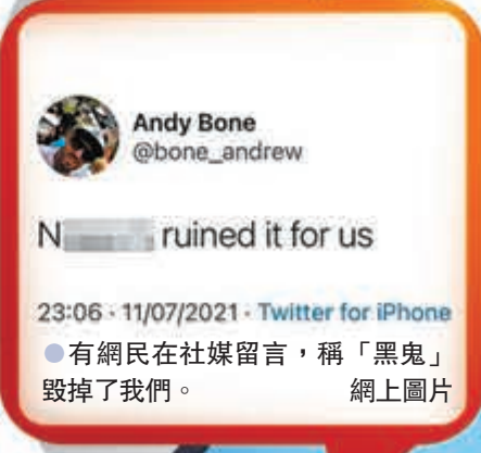
●有網民在社媒留言，稱「黑鬼」毀掉了我們。網上圖片