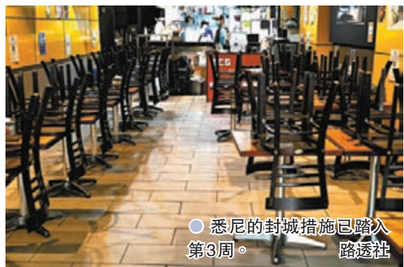
悉尼的封城措施已踏入第3周。

澳洲最大城市悉尼的封城措施已踏入第3周，但最初在印度發現的Delta變種病毒仍然繼續擴散，昨日新增112宗本地確診個案，連續3日創新高。當局原定周五解封，但疫情仍未受控，或需延長封城期限。