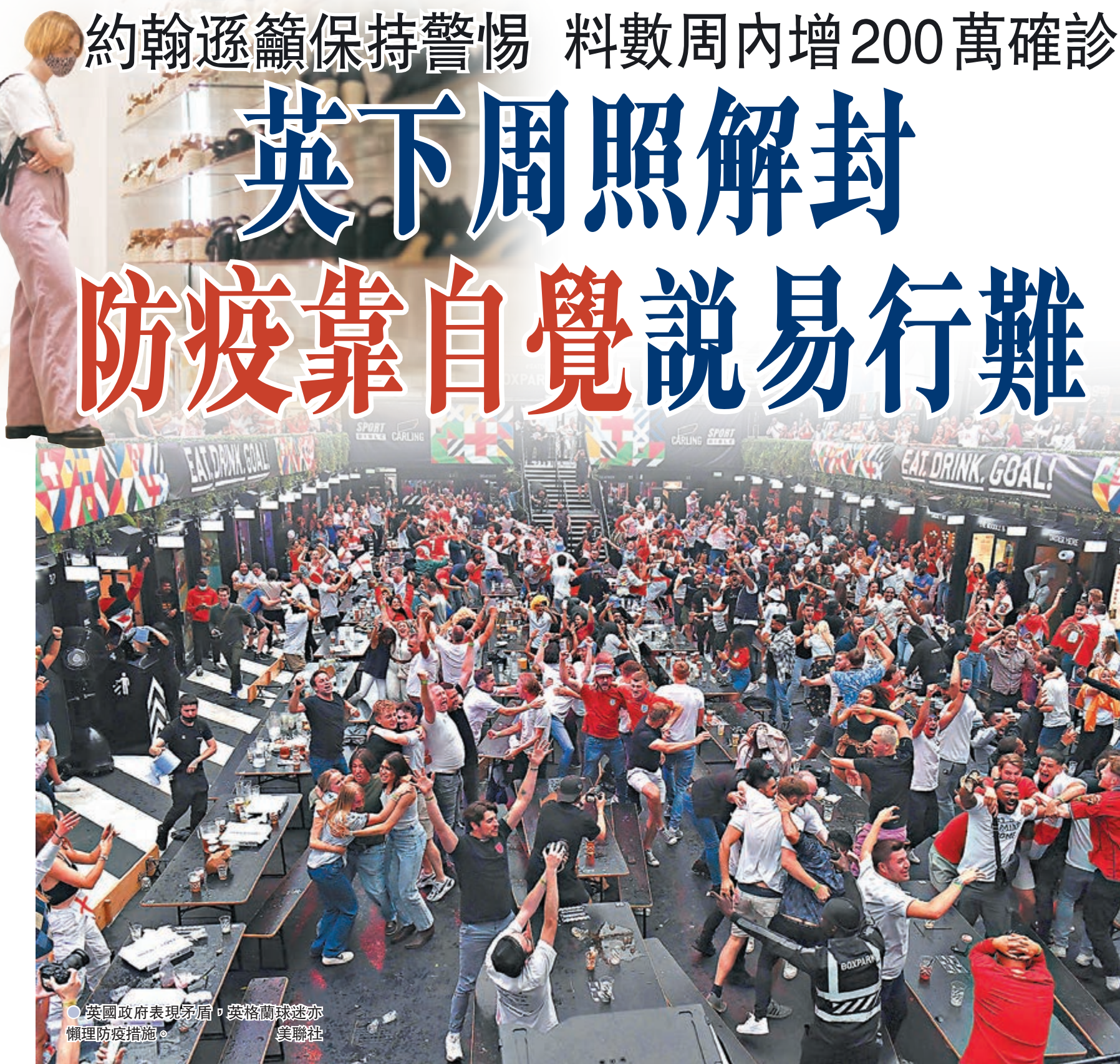
英國政府表現矛盾，英格蘭球迷亦懶理防疫措施。