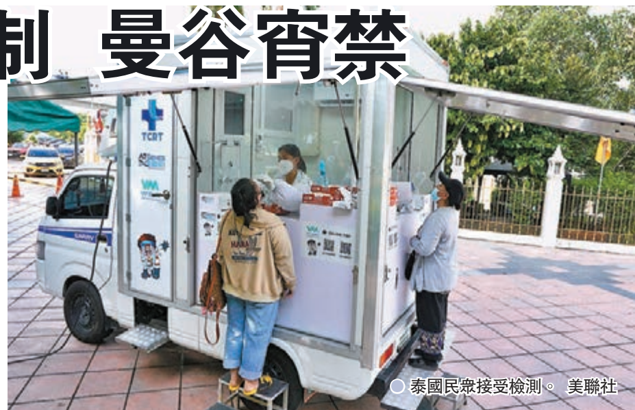
泰國民眾接受檢測。