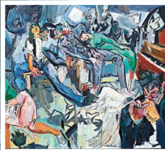
● 《在那高山頂上》180x200cm 2019年創作