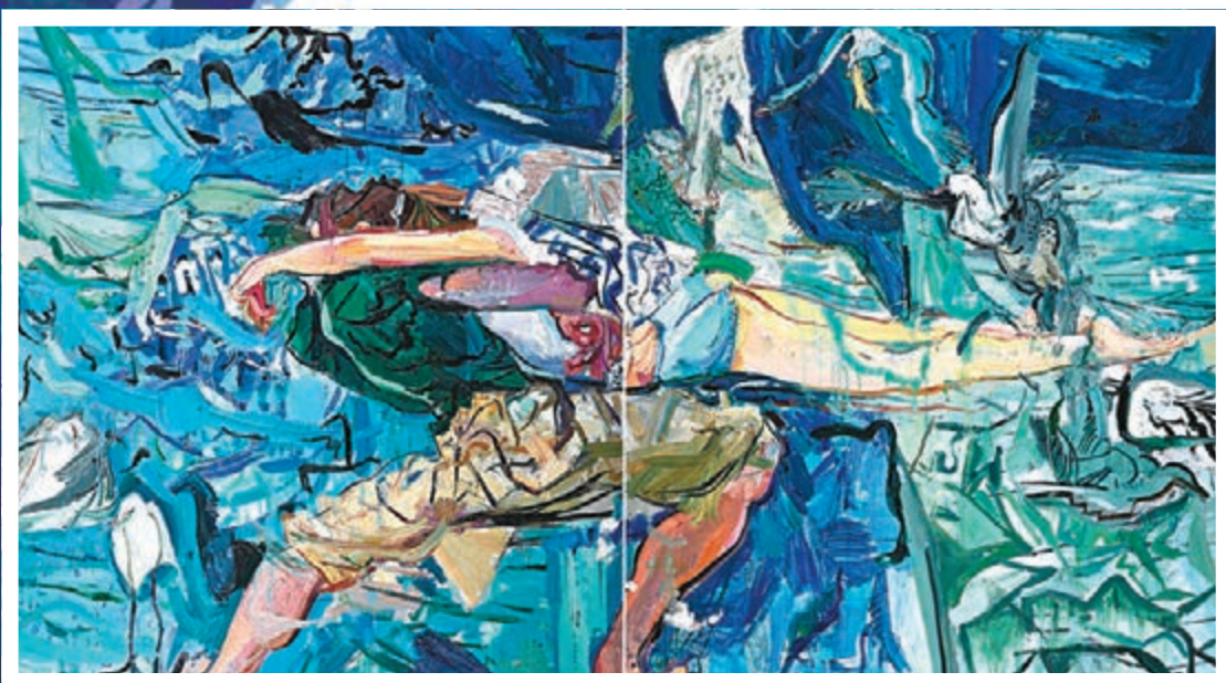
● 《我的青春小鳥依舊不回還》200x180cmx2 2017年創作