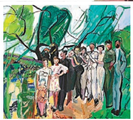
● 《那些親密的時光》180x200cm 2020年創作