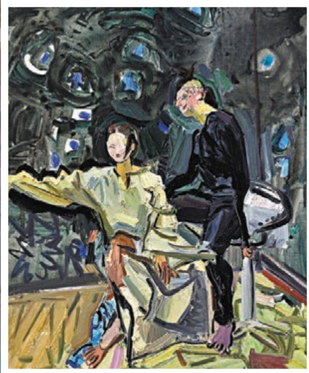
● 《那些花兒都閉了》之四 60x50cm 2015年創作

作為女性藝術家，閔平多年來以超常的藝術韌性創作了大量作品，投注其中的心力堪稱不讓鬚眉，而她關切現實、關愛生命的視角和態度，更是讓我們看到她真摯的情感和純粹的心靈。在駁雜的藝術圖景中，純粹的藝術初衷和純粹的語言表達尤其顯得可貴，閔平作品的色彩色澤如此燦爛濃郁，而從中透溢的藝術品質和格調又如此不落凡俗，這本身就是一種情懷的體現和自信的表徵。在她光色交織、淋漓酣暢的油畫語言中，疊印着我們所處時代社會發展的蓬勃生機，這是她為中國油畫走出中國氣派和時代風貌之路作出的貢獻。