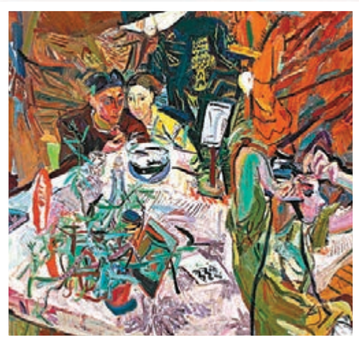
● 《小魚兒是自由的》180x200cm 2012年創作