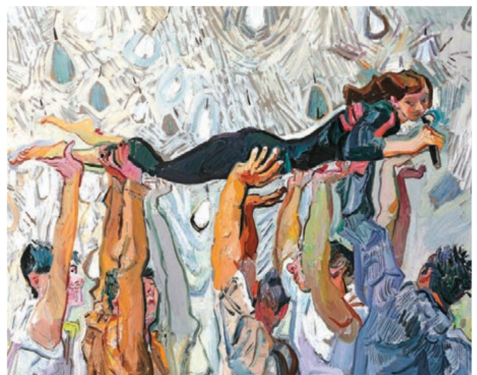
● 《我看到了星空之一》160x200cm 2020年創作