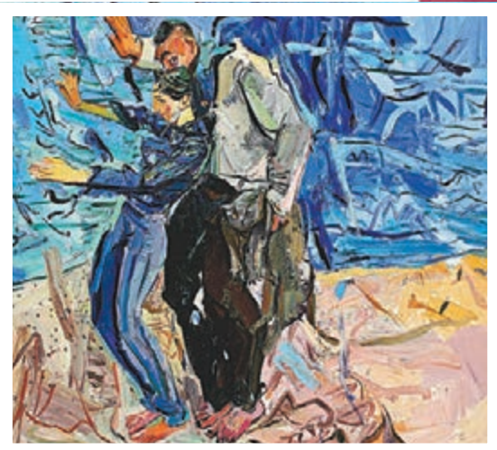
● 《去大海 去天邊》180x200cm 2014年創作