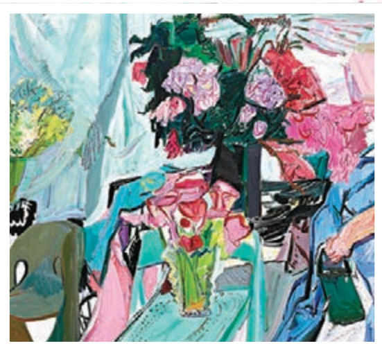
● 《花匠》180x200cm 2021年創作