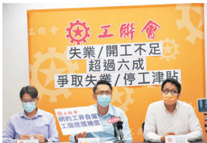
●工聯會促請特區政府即時發放緊急失業或停工現金津貼，創造更多職位、容許以個人名義申請綜援等。