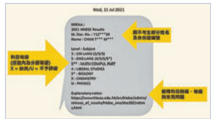
●SMS發放文憑試成績樣本。

如考生於6月24日11時前仍未收到提示SMS，可聯絡所屬學校或公開考試資訊中心。