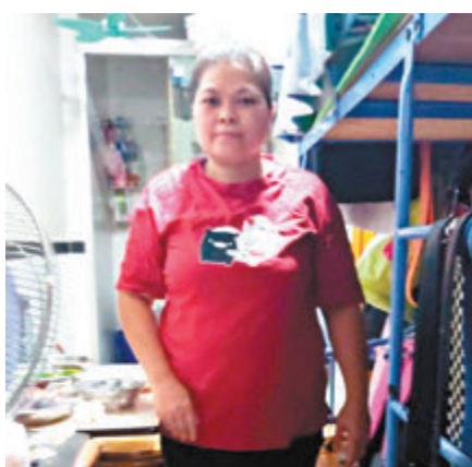
▲韓女士指，或會把將來可領取的現金津貼，用於送女兒參加補習班。