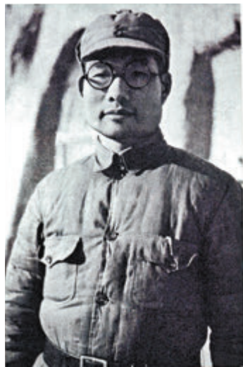
1937年12月，肖勁光任八路軍留守兵團司令員兼政治委員。

1921年，18歲的肖勁光是首批赴蘇聯莫斯科東方大學學習的學生，聽過列寧講演。1923年應召返回祖國參加北伐戰爭。1927年大革命失敗後再度赴蘇學習，1929年返回參加中央蘇區土地革命戰爭。新中國成立後他臨危受命，不僅成為新中國第一任海軍司令員，也是世界海軍史上擔任此職務時間最長的司令員，整整掌兵中國海防三十年，被譽為「人民海軍之父」。肖勁光孫女肖雨青接受香港文匯報採訪時說：「在爺爺的心裏，擔當是一個共產黨員最基本的品質，而這種擔當精神也成為了他傳給後代們的家風。」