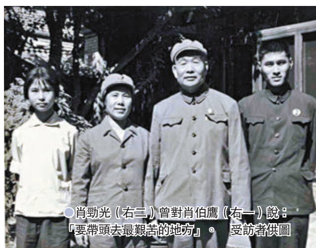
肖勁光(右二)曾對肖伯鷹(右一)說：「要帶頭去最艱苦的地方。」

肖勁光夫婦育有8子，他非常注重對後代的嚴格培養與教育，在家用極高的標準要求每一位家庭成員。吃飯，不允許地上、桌上、碗裏有一片菜葉、一粒剩飯；穿衣，大的穿完小的穿，過年過節也難見新衣服；個人衛生、待人接物禮儀等等細節，也都有嚴格要求。