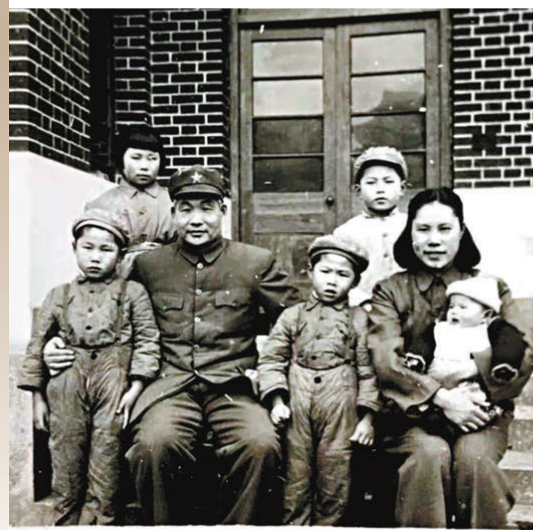
▼1949年拍攝的肖勁光全家福。