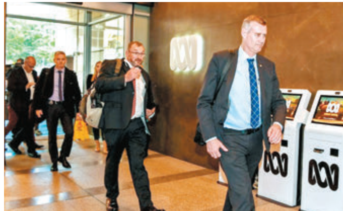
●澳洲警方指控ABC涉洩公開機密文件。

2019年6月，澳洲警方突然搜查澳洲廣播公司(ABC)位於悉尼的總部，以涉嫌洩露國家機密為由，調查於2017年披露澳洲軍方於阿富汗殺死平民的ABC記者和管理層。