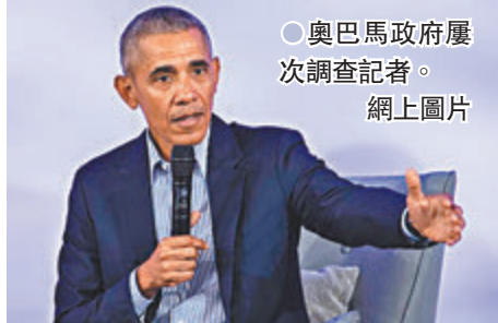
●奧巴馬政府屢次調查記者。

美國政府在上月及本月初先後公布，前總統特朗普的政府曾多次收集記者的通訊記錄，以調查記者過往報道的洩密來源；做法並非先例，民主黨籍前總統奧巴馬同樣曾多次調查洩密人或吹哨人等，面對「損害新聞自由」的質疑，奧巴馬曾強