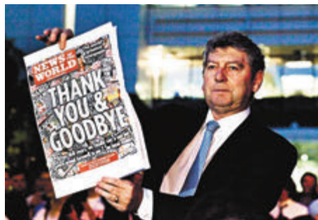
●《世界新聞報》最後一位總編輯向外界告別。

事件曝光後，《世界新聞報》多名前任編採人員相繼被捕，包括2002年出任報紙總編輯、後來晉升為母公司新聞國際行政總裁的布魯克斯，以及接替她出任總編輯的庫爾森；同時新聞國際控股公司新聞集團與英國