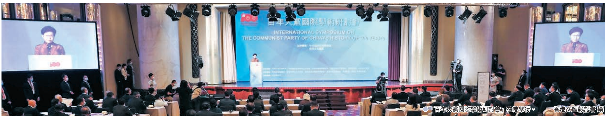
「百年大黨國際學術研討會」在港舉行。

功經驗、理解把握中國共產黨十八大以來治國理政的新理念新思想新戰略、從「一國兩制」看中國共產黨對全球治理作出的貢獻、展望中國共產黨在構建人類命運共同體方面的角色等主題進行深入研討。他們盛讚中國共產黨所取得的世人矚目的偉大成就，高度評價中國共產黨是當代最成功的政黨。 ●香港文匯報記者 鄭治祖