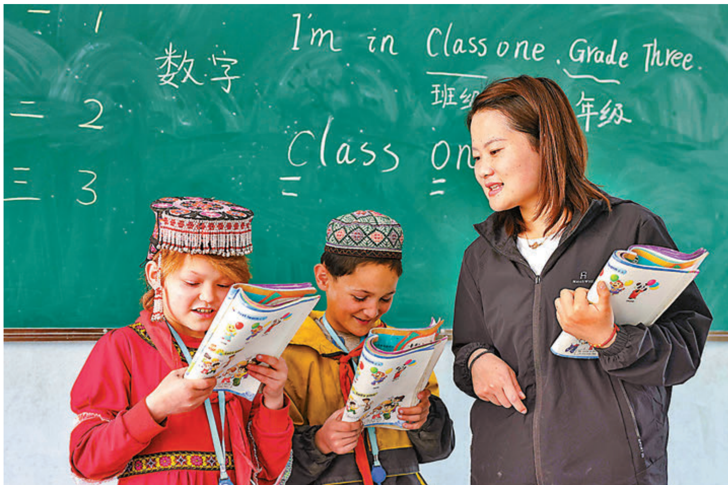
●2010年至2020年，新疆總人口和維吾爾族人口均保持穩步增長的態勢，其中維吾爾族人口增加162.3萬人，增長16.2%。圖為今年5月新疆阿克陶縣阿勒瑪勒克村小學的小學生與當地支教老師在英語課堂上互動。

香港文匯報訊 據中新社報道，天山網14日發布《新疆維吾爾自治區第七次全國人口普查主要數據》，第七次全國人口普查與第六次全國人口普查相比，總人口增加了403.9萬人。漢族人口增加217.4萬人，其中：跨省流入增加194.8萬人；維吾爾族人口增加162.3萬人，增長16.2%。新疆統計局有關負責人就新疆第七次全國人口普查答記者問時表示，2010年至2020年，新疆總人口和維吾爾族人口均保持穩步增長的態勢，人口質量穩步提升，受教育程度明顯提高，人口流動集聚的趨勢更加明顯，城鎮化水平持續提高。