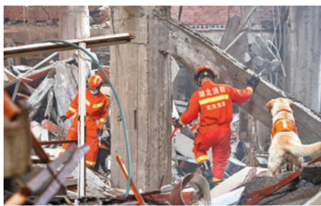
●湖北十堰燃氣爆炸已造成25人死亡。圖為6月13日消防救援人員和搜救犬在現場搜救。

湖北十堰燃氣爆炸事故發生後，國務院安委會、應急管理部持續調度現場救援處置進展，立即派出由應急管理部領導帶隊的工作組趕赴現場指導事故處置工作，要求做細做實搜救工作，切實做好傷員救治，盡最大努力減少傷亡；徹查事故過程和原因，依法依規嚴肅追責。國務院安委會決定對該起事故查處進行掛牌督辦。應急管理部已聯合住建部等部門推