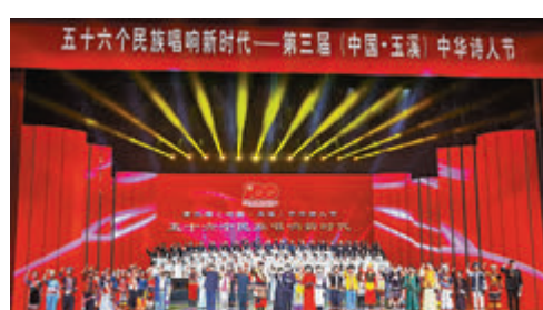
●第三屆(中國·玉溪)中華詩人節在玉溪市舉行。

活動期間，全國詩詞名家雲集玉溪采風，感受人文風情，領略自然美景。雲南玉溪享有「四鄉」——聶耳故鄉、雲煙之鄉、花燈之鄉、高原水鄉的美譽。近年來，該市成功創建中國最佳楹聯文化城市、中國楹聯文化強市，並晉入「中華詩詞之市」行列。