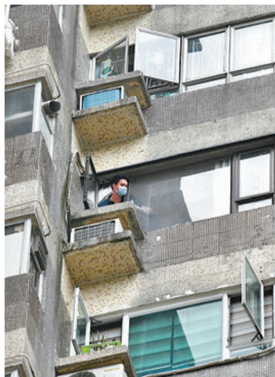
●探員在涉案單位窗口處調查，懷疑男死者由該處拆除窗花後跳下。

林慶璋警司續指，現場並無發現遺書，至於虛掩木門及鐵閘未上鎖，相信是男死者生前故意安排，惟其殺妻動機需進一步調查，警方將循多方面，包括夫婦的感情、財務，以及身體和精神狀況着手，但初步調查顯示夫婦過往關係良好，沒有家暴記錄，近期亦沒有衝突。案件現作謀殺及自殺案交由屯門警區重案組跟進，稍後將為兩名死者進行剖驗以確定死因。