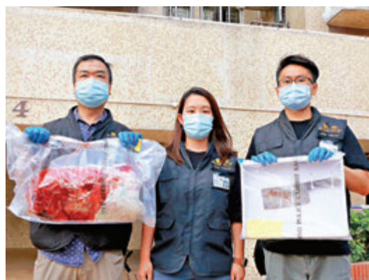
●警方檢走涉案菜刀及染血床單等證物。

屯門警區助理指揮官(刑事)林慶璋警司表示，經調查證實兩名死者為夫婦關係，由於現場並無打鬥、搜掠及掙扎痕跡，客廳窗口的窗花則被人拆下，不排除有人趁妻子熟睡時，用菜刀斬殺，再畏罪跳樓自殺斃命，而女死者在遇襲後相信瞬間即陷於昏迷，至於女死者是否曾服下藥物仍要調查。