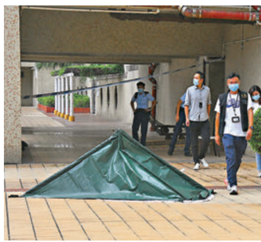
●男死者涉嫌殺妻後跳樓飛墮平台當場斃命。