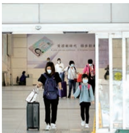
●「回港易」的認可檢測機構太少，不利市民往返兩地。

檢討改善，只重申計劃的具體執行方法，強調香港居民經「回港易」回港，須在廣東省獲粵港兩地政府認可的醫療機構做檢測，有關名單已載於「回港易」計劃網站。