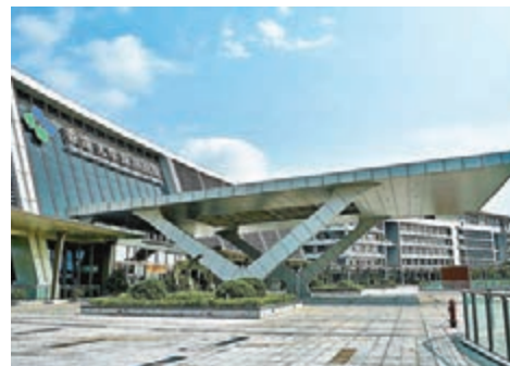
●港大深圳醫院至5月底已為在內地的港人安排21,120個診症預約，當中約16,860人次已接受診症服務。 資料圖片

香港文匯報訊（記者 成祖明）疫情下掀起了出行互認的新問題，還在跨境醫療的舊議題上凸顯出有待理順之處。受新冠肺炎疫情影響，香港與內地均採用控關政策，內地港人要返港覆診更為不便。特區政府在去年11月委託香港大學深圳醫院為已預約醫管局指定專科門診或普通科門診覆診的患者提供資助的跟進診症服務，截至上月30日，已為符合資格人士安排約21,120個診症預約，當中約16,860人次已接受診症服務。