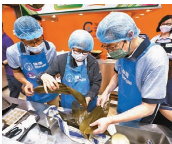
●軟餐粽製作方法簡單，將難以吞嚥的糯米替換為白米，加入鹹蛋黃等食材經料理機打碎後，倒入模型冷凍成型再包上粽葉，經蒸籠蒸熟即可。