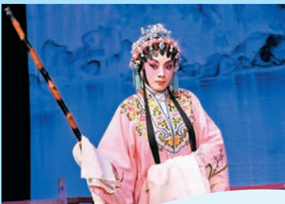
●《沈三白與芸娘》一劇以芸娘油盡燈枯而亡作結。