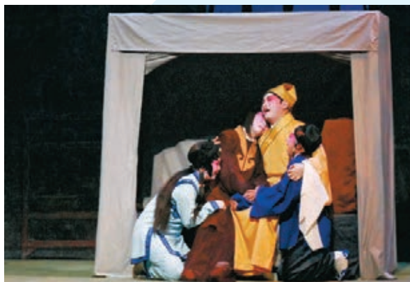
●《沈三白與芸娘》一劇以芸娘油盡燈枯而亡作結。