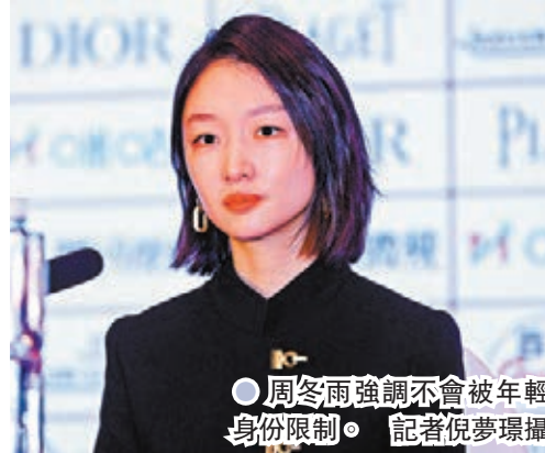
●周冬雨強調不會被年輕身份限制。