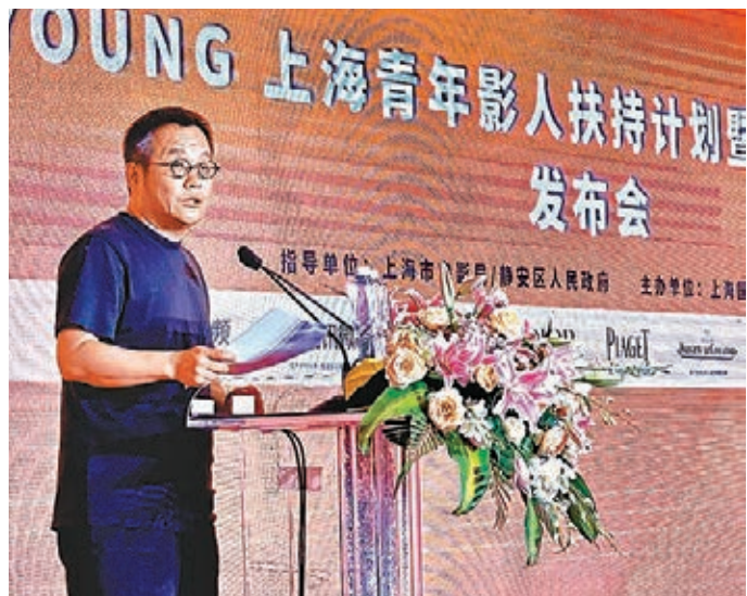
●評審團主席寧浩公布首批青年影人最終入圍名單。