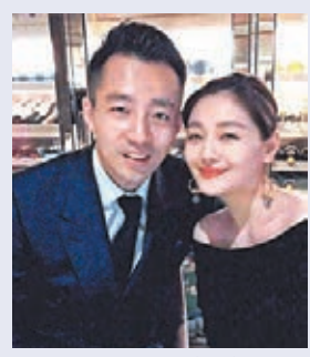
●大S與汪小菲結婚10年,經歷了不少風浪。

另外,由於持有台胞證,在大陸有提供免費施打疫苗福利,前「小虎隊」成員陳志朋日前在個人微博中晒出了自己在大陸接種疫苗的視頻,並配文:「打完第一針……謝謝母親的疼愛!」而蕭敬騰更早於本月2日已在上海接種了第一劑國藥疫苗。