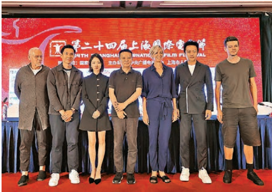
●上海國際電影節金爵獎評委齊亮相。