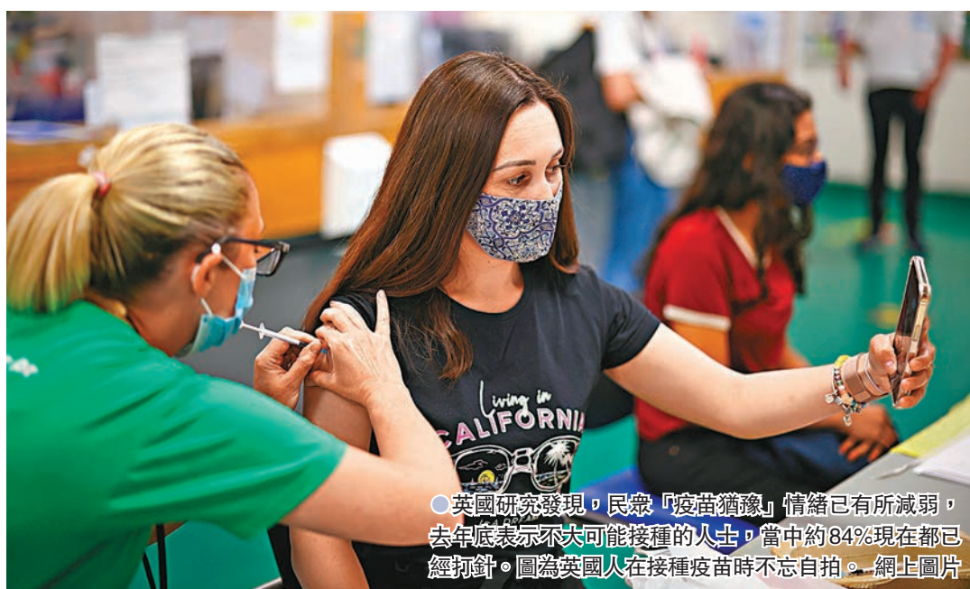
●英國研究發現，民眾「疫苗猶豫」情緒已有所減弱，去年底表示不大可能接種的人士，當中約84%現在都已經打針。圖為英國人在接種疫苗時不忘自拍。