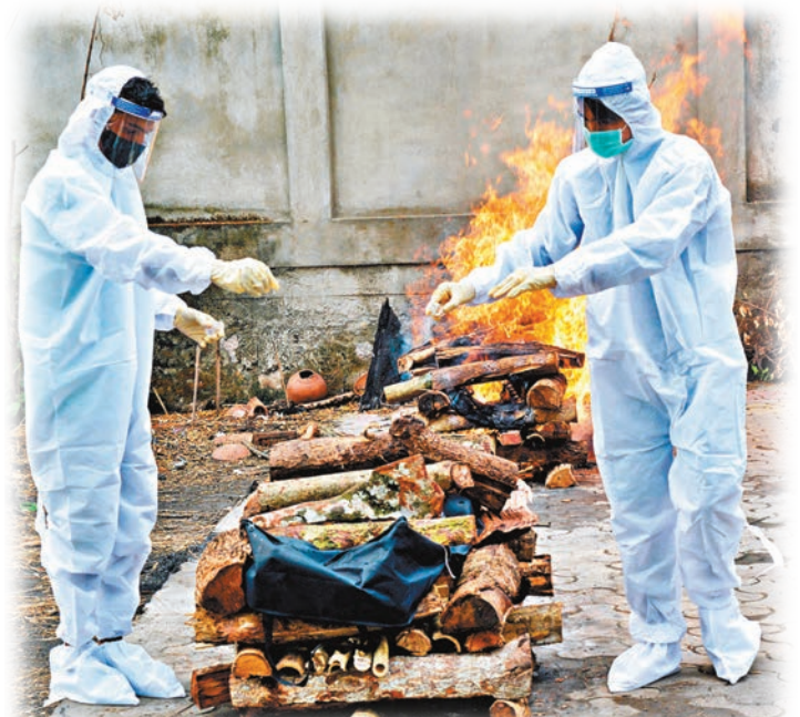
●印度許多家庭的父母疫歿，遺下大批孤兒。圖為印度火葬場人員為疫歿者進行火化。

印度新冠疫情嚴峻，許多家庭的父母均染疫身亡，遺下大批孤兒。印度國家保護兒童權利委員會統計，當地至少有1,742名兒童因疫情失去雙親，另有至少7,464名兒童失去父母其中一人。許多年輕人只能提早承擔養家重責，照顧年幼弟妹，哭訴自己「失去所有夢想」。