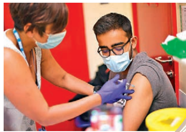
●不少專家呼籲政府為學童打針。圖為英國學生接種疫苗。

●美國臨床研究顯示，輝瑞疫苗對12歲至15歲青少年安全，近2,300名志願者中只錄得18宗感染個案，全屬安慰劑組別，證明可100%預防染疫。 ●青少年接種疫苗可能如成人般出現副作用，包括疲倦、頭痛、肌肉痛和發燒等。 ●美國雖然出現少數接種疫苗後患心肌炎個案，但無法確定與疫苗有關連。