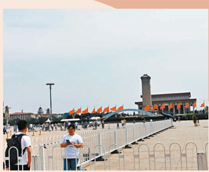
●天安門廣場中央搭建起拱形設施。