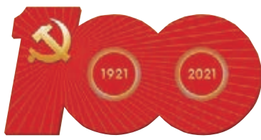
慶祝中國共產黨成立100周年 特別報道

香港文匯報訊(記者 張帥 北京報道)6月12日下午至13日凌晨,北京天安門地區及長安街沿線舉行建黨100周年慶祝大會核心要素首場演練。香港文匯報記者12日下午在長安街沿線跟進採訪看到,天安門廣場中央搭建有拱形設施,廣場東西兩側各樹立一塊顯示大屏,屏幕打出「系統測試中」五個字,至12日晚上8時夜幕降臨,屏幕開始出現「100」字樣。演練現場播放着音樂《歌唱祖國》。現場執勤人員稱,當晚演練集中在天安門廣場內進行,至13日凌晨2時左右,演練結束後周邊路口解除交通管制。