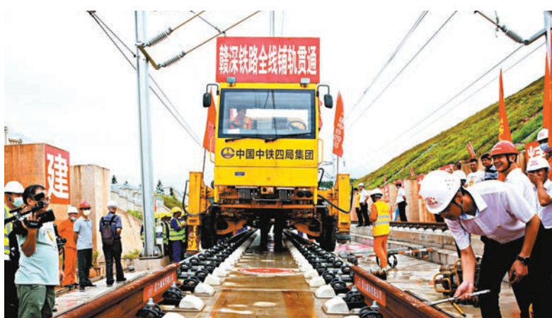
●贛深高鐵廣東段與江西段成功接軌。

香港文匯報訊(記者 郭若溪 深圳報道)12日上午,隨着最後一節500米長軌鋪設完成,贛(州)深(圳)高鐵路廣東段與江西段成功接軌,標誌着贛深高鐵路全線正線軌道鋪設完成。全線預計於2021年年底建成通車,屆時,贛州至深圳的通行時間將由現在的7小時縮短至2小時。