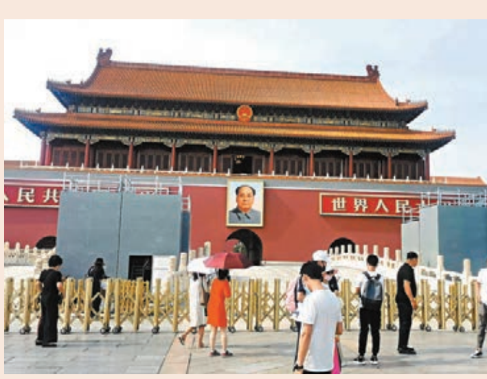
●天安門城樓前金水橋上,東西兩側已經搭建起4米高的腳手架。

以往內地舉行大型慶祝活動,都會安排香港觀禮團赴京。香港文匯報記者此前獲悉,在京部分港人代表已經獲得大會邀請,將參加7月1日舉行的中國共產黨成立100周年慶祝大會觀禮。