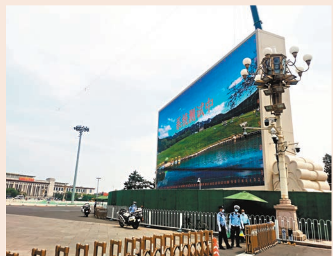
●天安門廣場兩側樹立的兩塊大屏幕正進行「系統測試」。