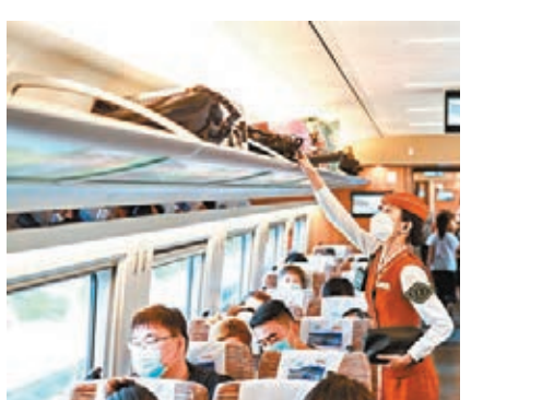
●端午小長假第一天,乘客從北京北站前往呼和浩特東站。中新社

據了解,端午假期前一日即6月11日,全國鐵路、公路、水路、民航發送旅客總量3,843.3萬人次,比去年同期增長45.2%,比2019年同期下降23.0%。