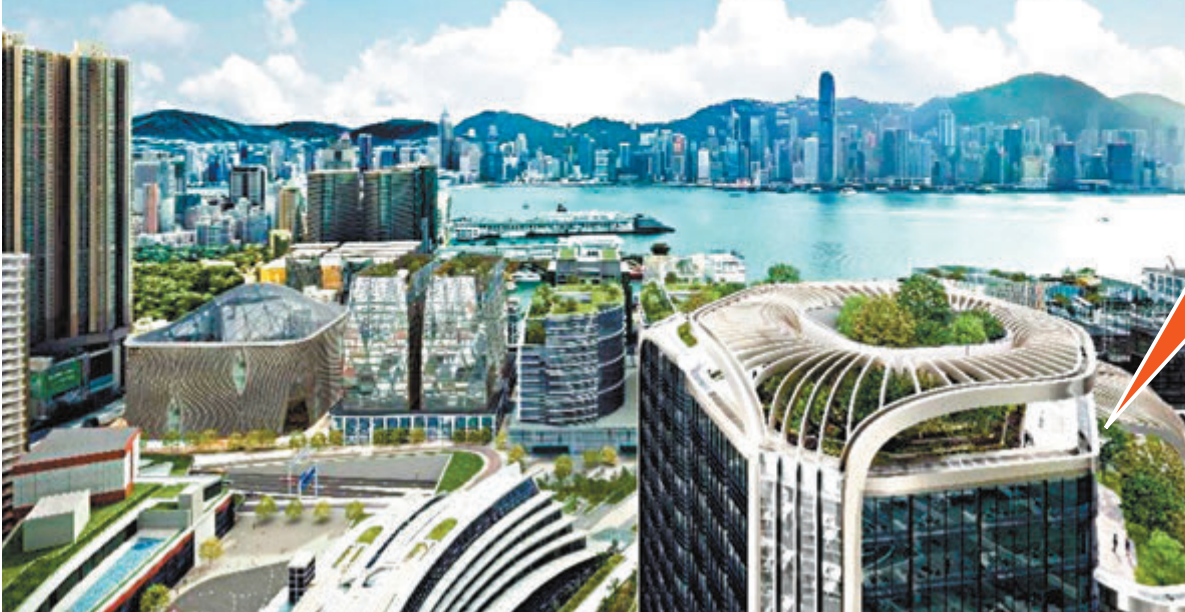
●根據最新方案效果圖，新地西九高鐵上蓋項目由T1天台觀景台可以望到西九文化區及維港，飽覽香港島的景觀。