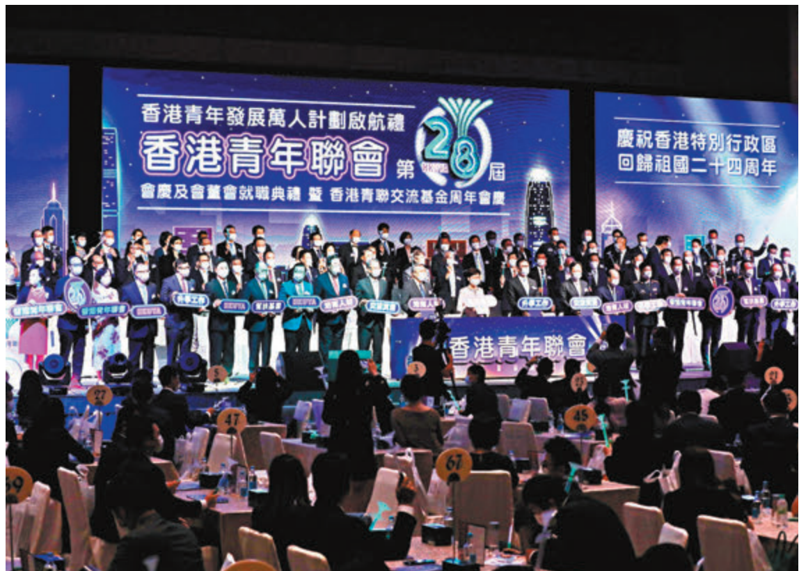
●香港青年聯會昨日正式啓動「香港青年發展萬人計劃」。