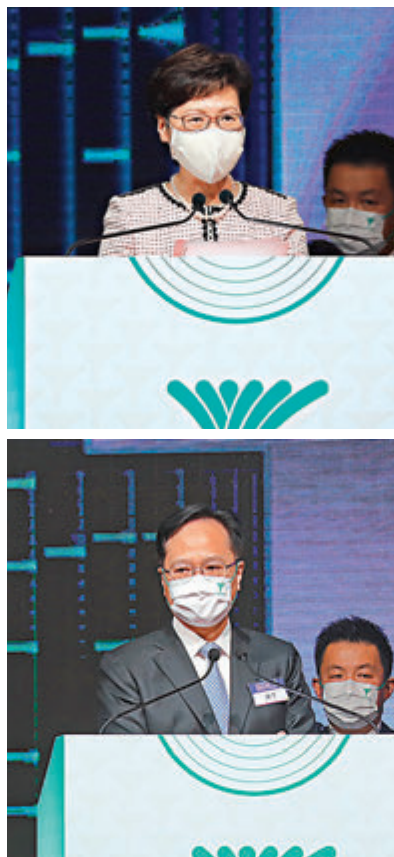
●林鄭月娥表示，特區政府繼續積極鼓勵青年人更主動融入國家發展大局。