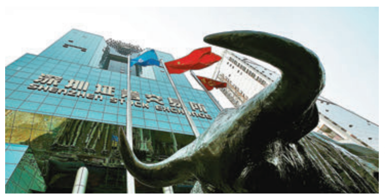
●受利好因素支持，A股近期表現向好。資料圖片

受利好匯集支持，近期A股展開反彈攻勢。在經濟成長率方面，中國不僅是去年少數正成長的國家，分析師更預估中國今年GDP成長率有機會逾8%，在全球名列前茅。在企業獲利表現方面，中國券商預計中國2021年非金融上市公司業績增速將達29%；在資金利好上，2021年以來中國新發行基金約5,264億元人民幣，為未來潛在的買盤。A股牛市可期，投資者可趁勢分批布局，政策及資金雙利好的消費類股將扮演領頭羊。