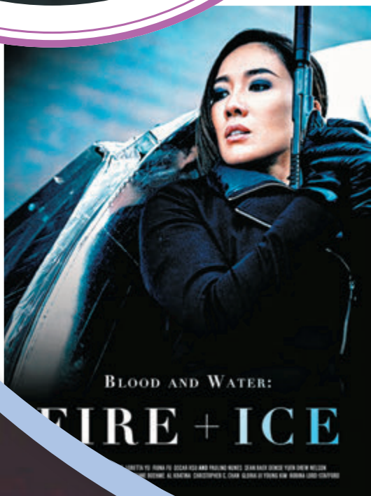
●劇集海報上，用上擔綱主角的李施嬅單人照。