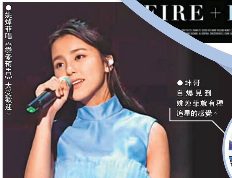
●姚焯菲唱《戀愛預告》大受歡迎。