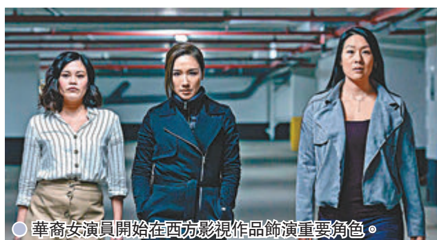
●華裔女演員開始在西方影視作品飾演重要角色。