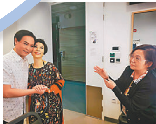
●龍貫天夫人(右)指導如何談情。

《血與水》系列在加拿大備受矚目，更罕有地以華裔演員擔任主要角色，一反西方影視作品中對華裔角色的刻板形象，不再是無關重要的配角，而是溫哥華警局的兇殺組首席探員，或如Selena在第二季中所飾演的冷酷女殺手，讓觀眾們得以一睹香港演員在海外有不一樣的精彩表現。