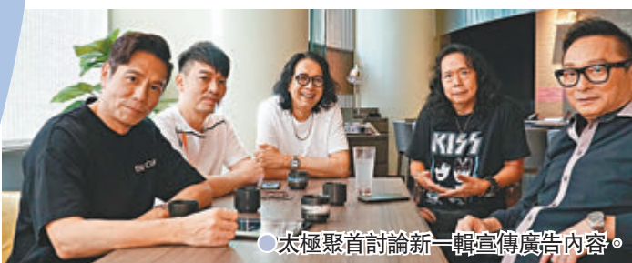
●太極聚首討論新一輯宣傳廣告內容。