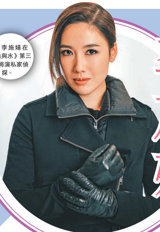
●李施嬅在《血與水》第三季飾演私家偵探。