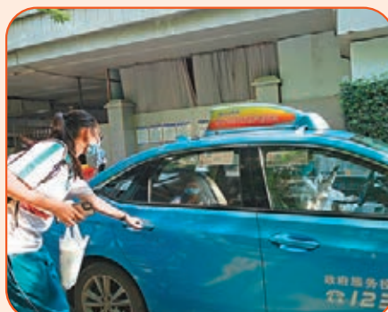
●廣東高考結束，一名來自高風險區域的考生坐上了愛心司機的專車。

昨日傍晚，高考最後一科正式結束，一天的暑氣漸漸消退。廣雅中學考點門外，陸續有考生走出。門外，早已有不少家長手抱着鮮花，張望尋找着走出考場的孩子。在考場外數百米處，停着一排藍色的出租車，駕駛員身穿全套防護服，他們隔着擋風玻璃，也在專注地看着陸續走出的考生。他們並非考生家長，對考生卻同樣關心，他們是「一對一」接送高風險考生的司機。 高考生陳同學(化名)徑直走出考場，穿過了湧動的家長和鮮花中，來到一個安靜的角落打電話。「我找林師傅，來接送的司機。我住在荔灣區海龍街，父母正在封閉隔離中，是林師傅冒着風險接送我考試的。」 陳同學說，他已經私下寫了一張賀