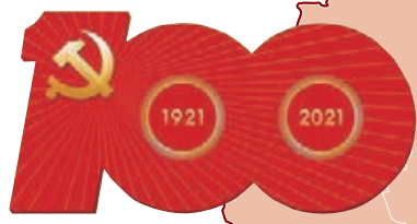
慶祝中國共產黨成立100周年