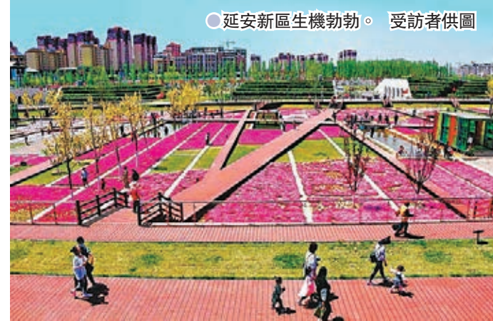
●延安新區生機勃勃。