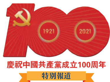
慶祝中國共產黨成立100周年 特別報道

香港文匯報訊（記者 馬靜 北京報道）中國共產黨成立100周年慶祝活動進入最後籌備和綵排階段，《北京日報》官方發布，本周末將舉行建黨100周年慶祝大會核心要素演練。香港文匯報記者獲悉，在京部分港人代表已經獲得大會邀請，將參加7月1日舉行的中國共產黨成立100周年慶祝大會觀禮。