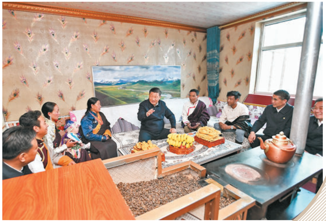
●6月8日，習近平走進藏族群眾家中了解生產生活情況。