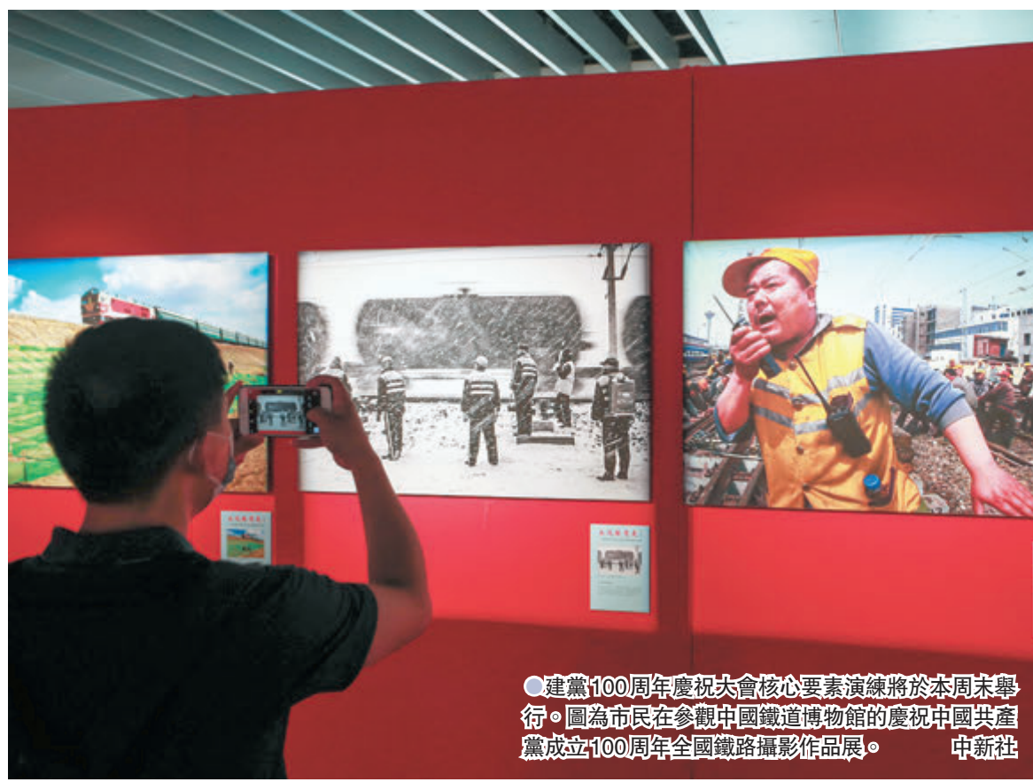
●建黨100周年慶祝大會核心要素演練將於本周末舉行。圖為市民在參觀中國鐵道博物館的慶祝中國共產黨成立100周年全國鐵路攝影作品展。

過往中央舉行大型慶祝活動都會安排香港觀禮團赴京。2019年新中國成立70周年慶祝大會，特區行政長官林鄭月娥率領逾240人組成的香港各界人士國慶觀禮團抵京，觀禮團成員包括特區政府官員，以及來自商界、法律界、傳媒界、教育界等界別的人士。在京港人代表亦獲邀參加國慶觀禮。