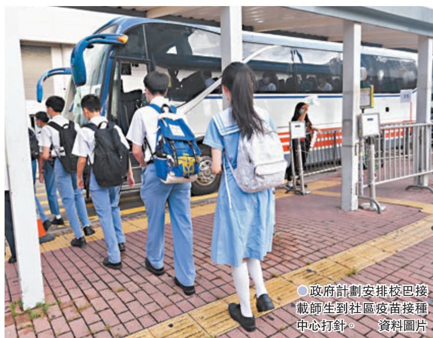
●政府計劃安排校巴接載師生到社區疫苗接種中心打針。資料圖片

至於兒童或青少年接種新冠疫苗前有什麼需要留意事項，關日華指出，家長可留意兒童或青少年有否嚴重過敏情況，及以往接種疫苗時有否出現嚴重反應。不過，他強調普通食物、蛋及抗生素過敏等均不需擔心。如果家長擔心，可以在接種疫苗前諮詢醫生或作皮膚測試，可為市民提供更多資訊及教育，以釋除疑慮。