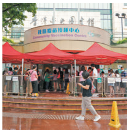
●在各種優惠措施鼓勵下，近日本港市民接種疫苗人數明顯上升。資料圖片

林鄭月娥指出，截至前晚，全港約有155.7萬人已接種第一劑新冠疫苗，佔合資格人口23.7%，相信隨着復必