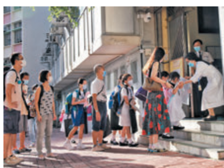
●有校長期望政府容許小一至小五的家長一同到校接種疫苗。資料圖片

接種年齡門檻適當下調，歡迎教育局到校打針的服務，中學一般有六七百人適合打針，連同家長，相信較易達到外展服務的人數門檻要求，但政府也應彈性處理小學外展接種的人數門檻。