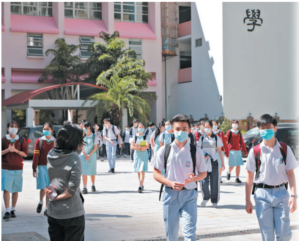
●復必泰疫苗接種年齡下限獲准放寬至12歲，政府為盡量方便學生打針，將安排派外展服務到校接種疫苗。資料圖片