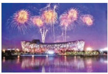
●2008年北京奧運開幕典禮於8月8日在宏偉的體育場——「鳥巢」舉行。

電筒、福娃搖鼓、祥雲熒光棒、飲用水、紙扇、雨衣等設備齊全，十分細緻。 這次開幕典禮是奧運歷史上電視轉播的高潮，在中國有8億多觀眾觀看，其它國家地區轉播的收視率也創造了歷屆新高。 奧運結束後，9月上旬，時任中外友協副會長的李小琳和我們一起出席了在巴黎聯合國教科文組織內舉行的「紀念世界人權宣言發表60周年」會議，與來自世界各地的千多位非政府組織人員交流了各國的人權狀況。 每當外國與會者見到我們，都主動上前恭賀北京奧運成功，勉勵一番，大家感到自豪外，也會體到通過京奧，讓世界更認識及關注中國，啟發許多不了解中國的外國人重新思考……我們的「奧運外交」是成功的。誠如我們在巴黎會議上說：「京奧成功只是一個好開始，希望所有人都能延續奧林匹克精神，再接再厲，創建和諧社會，讓世人獲得真正幸福。」 (待續)