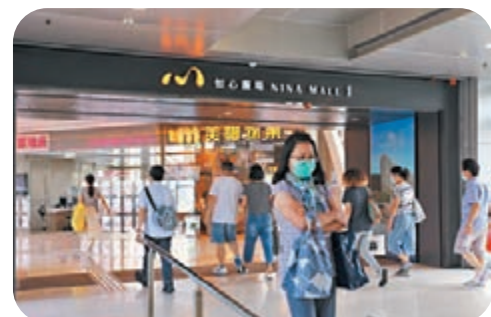
●確診變種病毒株女患者在5月29日，曾到荃灣如心廣場商場一期及二期。