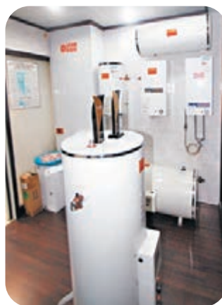
●商戶擬以抽獎送出10部電熱水爐予已接種兩劑疫苗的本報讀者。圖為該店展示的電熱水爐。

有關熱水器售價為4,800元，不包含安裝，中獎者亦可根據自身情況兌換不高於該價格的同品牌小型熱水器。具體參與辦法將稍後公布。