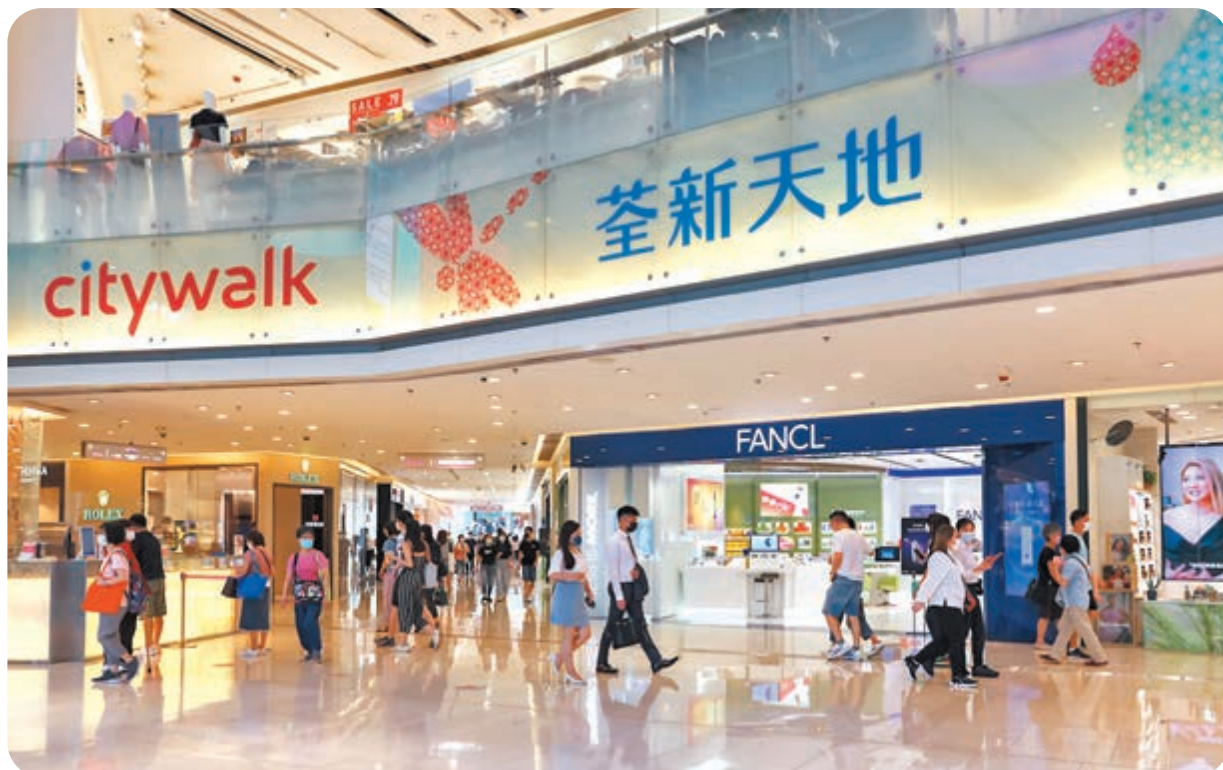
●感染變種病毒株的17歲女生，其20歲胞姊也證實確診，該女患者在5月29日曾到荃灣荃新天地商場。