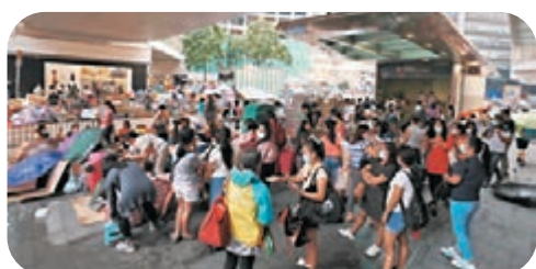
●外傭市場供不應求，圖為周日外傭在中環聚集。

他指出，目前仍未出現外傭不斷轉工選擇僱主的情況，因為近半年入境處在審批斷約外傭工作簽證方面非常嚴謹，如果外傭轉工超過一次，即使找到新僱主，如沒有合理的離職原因，處方很多時都不會批出新工作簽證。