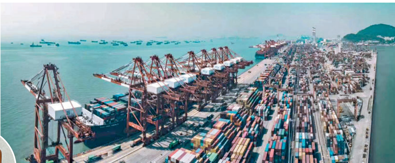
港。圖為蛇口港繁忙的作業。鹽田港因疫情導致貨櫃處理業務大降，大量貨物轉到蛇口

鹽田國際集裝箱碼頭出現港口人員感染病例，自5月21日實施嚴格消毒及檢疫措施，大量貨櫃運輸受阻。金融數據機構「路孚特」（Refinitiv）編制的船隻追蹤和港口數據顯示，6月3日有超過40艘貨船停泊在鹽田港外。不少國際集裝箱航運公司表示，將取消一些船舶停靠鹽田港，以減輕塞港壓力，一些船舶被迫改道前往其他港口。