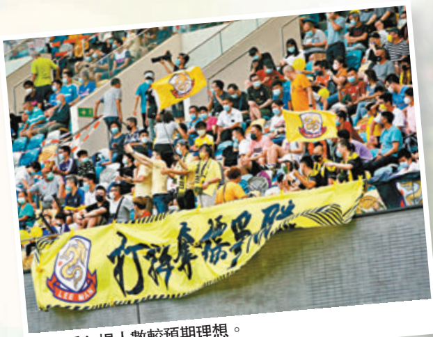
●今季入場人數較預期理想。