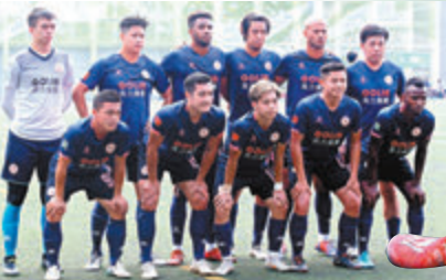
●高力北區陣中有多名前港超腳坐鎮。

們今季班費超過100萬元，但過去幾年一直是踢業餘波，一時間要上港超，不但管理層要有很大轉變，球員及各方面部署也完全是另一回事。」不過他也並未否定會升班的可能性：「我不敢說完全沒可能，將來的事沒人會知，只是到目前這一刻來看，我們在各方面都沒準備好，所以來季升上港超的機會很微。」