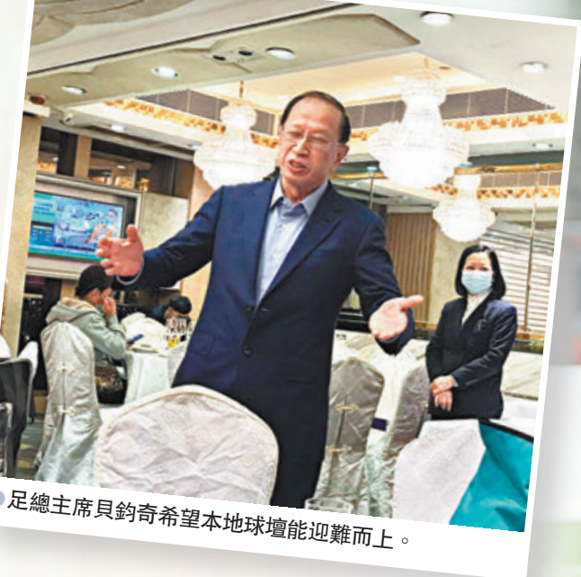
●足總主席貝鈞奇希望本地球壇能迎難而上。