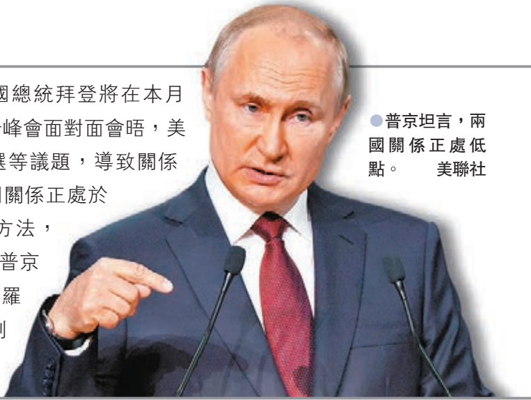
●普京坦言，兩國關係正處於低點。

俄羅斯總統普京與美國總統拜登將在本月16日，於瑞士日內瓦舉行峰會面對面會晤，美俄近年因網攻、干預大選等議題，導致關係惡化，普京日前坦言兩國關係正處於低點，在峰會需要尋找方法，讓兩國關係正常化，不過普京同時指控美國試圖遏制俄羅斯發展，手段包括經濟制裁、干預俄羅斯內政等。