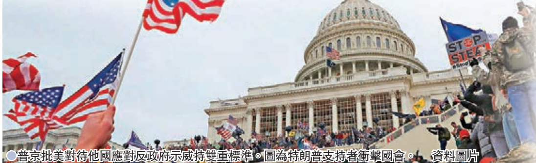
●普京批美對待他國應對政府示威持雙重標準。圖為特朗普支持者衝擊國會。