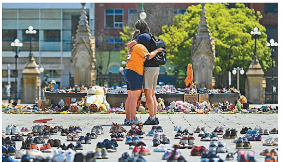
●民眾悼念喪生的215名兒童。

加拿大卑詩省一間原住民寄宿學校舊址近日發現215具兒童遺骸，總理杜魯多前日表示，對於當年負責營運原住民學校的羅馬天主教會從未就此正式致歉，深感失望，呼籲教會主動採取行動「承擔責任」。然而多名歷史專家指出，原住民兒童寄宿學校系統由加國政府建立和資助，批評杜魯多推卸責任。