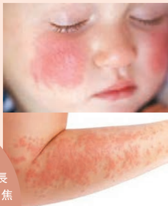
● 濕疹經常出現的位置

皮膚是人的心理器官，若長期處在過度緊張、過度疲勞、焦慮失眠等精神狀態下，也易於導致濕疹發生、加重。所以，濕疹患者要學會規律作息，放鬆心情。