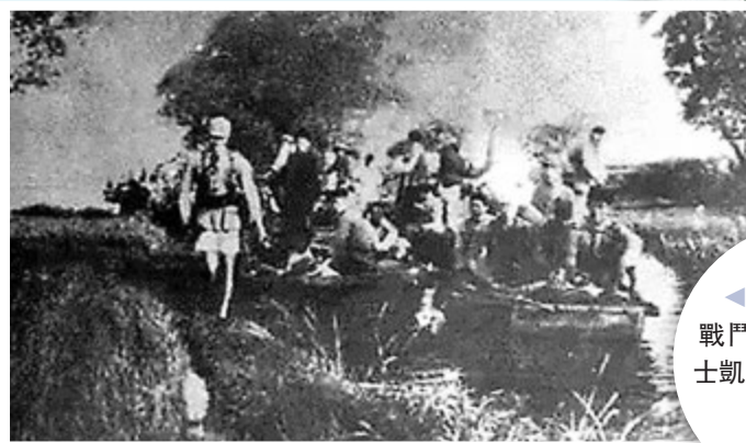
▲參加蔣家河口戰鬥的第四支隊戰士凱旋歸來。