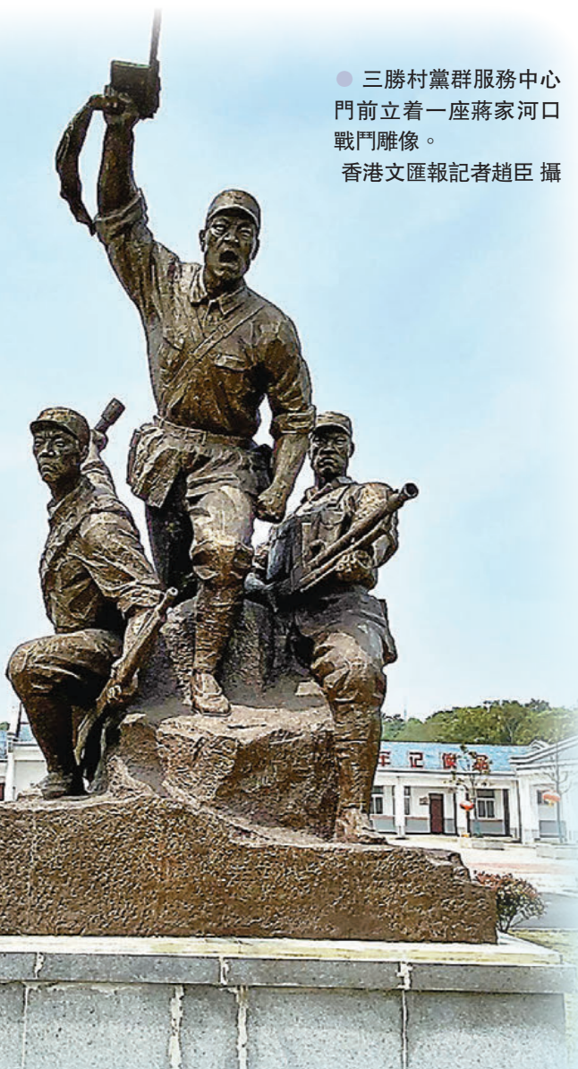
●三勝村黨群服務中心門前立着一座蔣家河口戰鬥雕像。