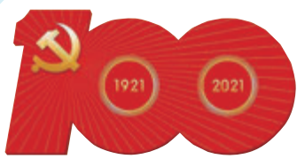
慶祝中國共產黨成立100周年