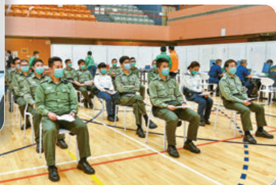
▲部分懲教署人員早前已獲優先接種疫苗。資料圖片