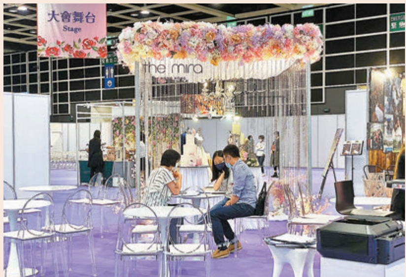
●香港結婚節暨婚紗展昨日舉行，有準新人到場了解各種婚禮套餐。

香港文匯報訊(記者 美釵)特區政府推出的「疫苗氣泡」政策，容許D類食肆舉行最多100人的宴會，但前提是員工及賓客全部已經接種疫苗。有準新人昨日表示，該政策下搞婚宴仍困難重重，最大問題是賓客未必配合打針，尤其一些長輩抗拒打針，唯有押後婚期，「無理由強迫他們因為要參加我哋婚宴而去打針。」有婚禮策劃公司表示，疫下新人「變招」，多數改為鋪張地搞過門儀式，晚宴則取消，令婚宴及婚禮生意大縮水。