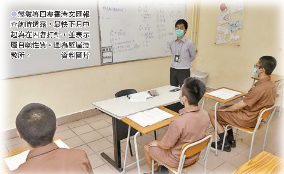
●懲教署回覆香港文匯報查詢時透露，最快下月中起為在囚者打針，並表示屬自願性質。圖為壁屋懲教所。

香港新冠疫苗接種計劃開展至今3個月，各群組也幾乎已覆蓋，惟在囚者一直未被納入計劃，加上社區疫苗接種中心或於9月後停止運作，在囚者出獄後或錯過接種計劃。懲教署昨日在回覆香港文匯報查詢時透露，最快下月中起為在囚者打針，並表示這是自願性質。有專家認為，懲教院所內人群聚集情況比社區密集，須更高的疫苗接種率才能達到群體免疫，故安排在囚者自願接種疫苗的工作實刻不容緩。更生者提到，院所內資訊流通程度較低，建議署方邀請專家到院所講解打針的好處，以提高接種率。