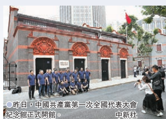
●昨日，中國共產黨第一次全國代表大會紀念館正式開館。

這間會議室，現在也成為萬千黨員的精神家園。2017年10月31日，中共十九大閉幕後不到一周，中共中央總書記習近平就帶領中共中央政治局常委瞻仰上海中共一大會址，重溫入黨誓詞。習近平曾動情地