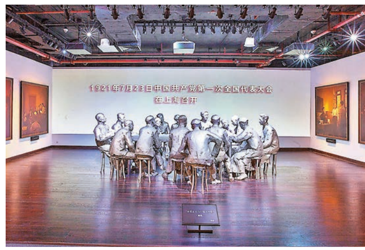
●這是二樓的展廳用雕塑形式還原一大會議場景。