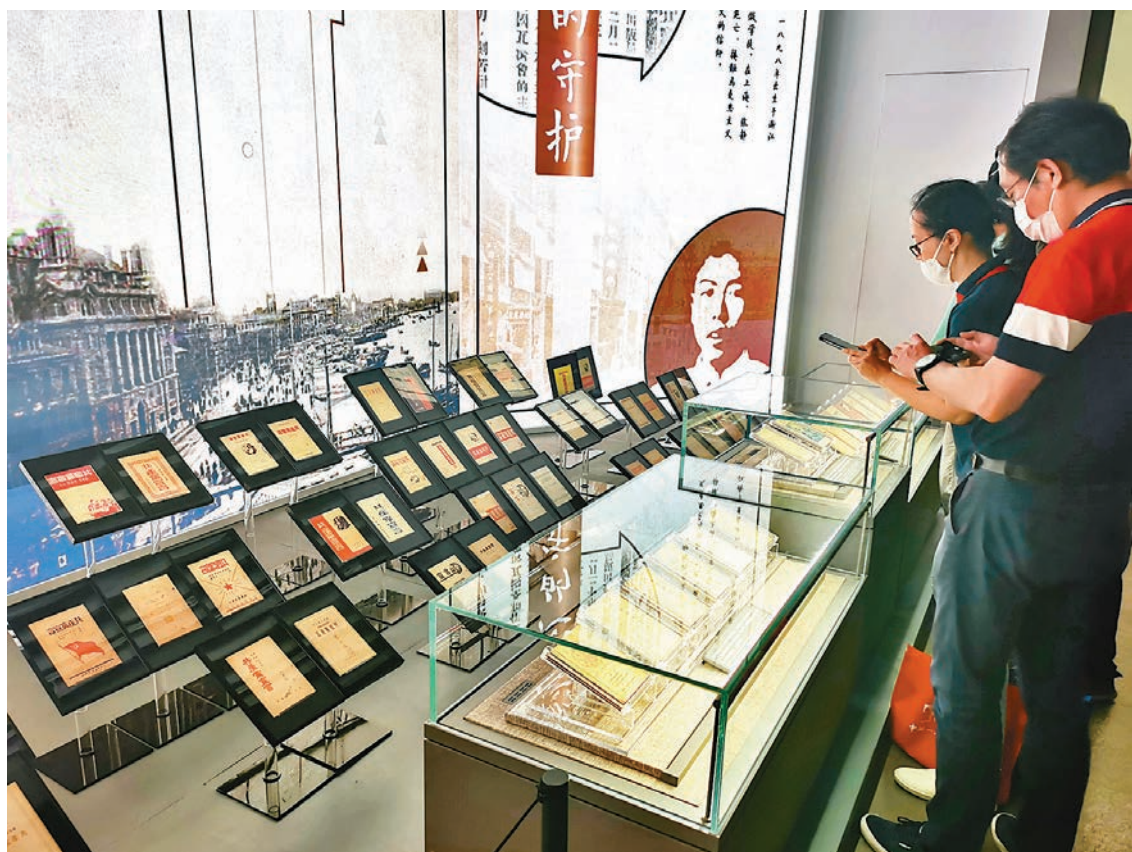
●紀念館將館藏的72版本《共產黨宣言》全部展示出來。

現場工作人員告訴香港文匯報記者，紅版為1920年8月出版，首版印刷了1,000冊，比現今的小32開還略小，封面印着紅底的馬克思半身坐像。讓今人莞爾的是，由於印刷排版倉促，封面的書名被錯印成《共產黨宣言》，但依然在知識分子群體中掀起購買與閱讀熱潮，1,000冊很快便告售罄。9月，在勘誤之後，《共產黨宣言》中譯本又再版了1,000冊，封面的馬克思坐像底色改為藍色，也就是現在通常所說的「藍本」。與首版相仿，第二版同樣熱銷，以致許多讀者致信《新青年》、《民國日報》，詢問購書事宜。這本書對當時先進知識分子樹立正確的馬克思主義信仰，發揮了極其重要的作用。至1926年5月，