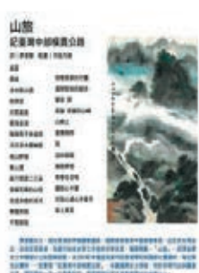
●筆者在少年時期參加中部橫貫公路健行靈感所得。

台灣的制度是否出了嚴重的問題？如此工程竟欠缺監管，是否有官商勾結？是否有包庇行為？這一場慘絕人寰的交通意外的處分是否被新冠肺炎的疫情蓋過問責？