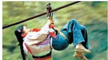
●不是耍演技，是上學呀！