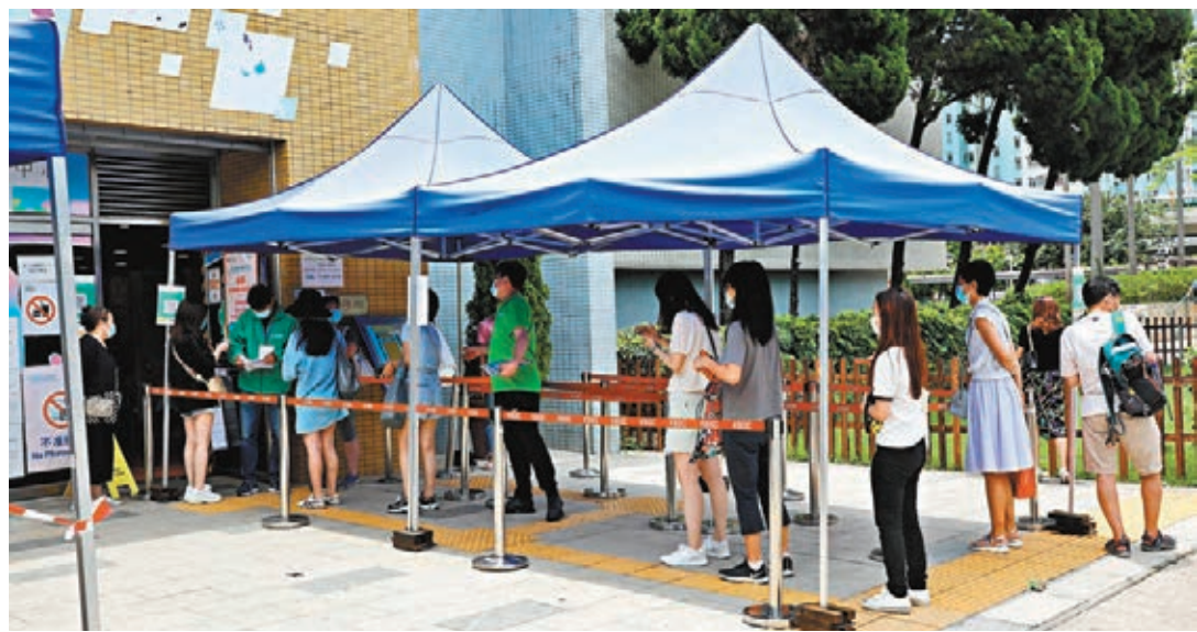
●九龍灣體育館科興疫苗接種中心，接種者絡繹不絕。