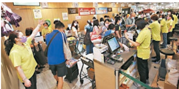
●一田百貨為打針顧客提供九五折優惠。