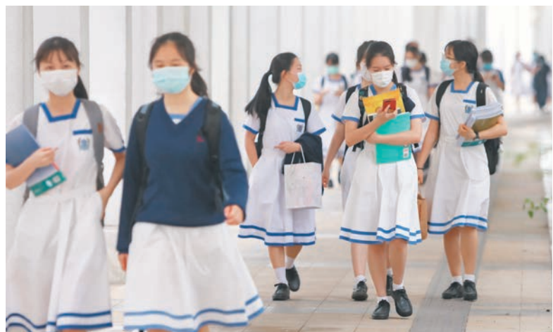
●專家望降低接種年齡限制後，讓接種率達六七成的學校全面恢復面授課程。