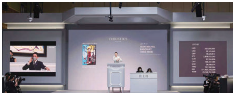
佳士得拍賣現場。

佳士得香港春季拍賣周日前落下帷幕，成交總額高達港幣35億/美元4.58億。亞洲買家持續於全球拍賣貢獻卓著，買家分別來自全球58個國家，總成交比率高達88%，逾半數拍品成交價超越前高估價，整個拍賣周所有品類共錄得38個世界紀錄。