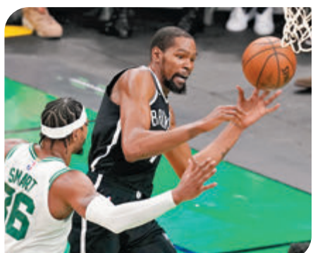
杜蘭特獨取42分。