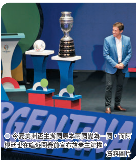
今夏美洲盃主辦國原本兩國變為一國，而阿根廷也在臨近開賽前宣布放棄主辦權。資料圖片