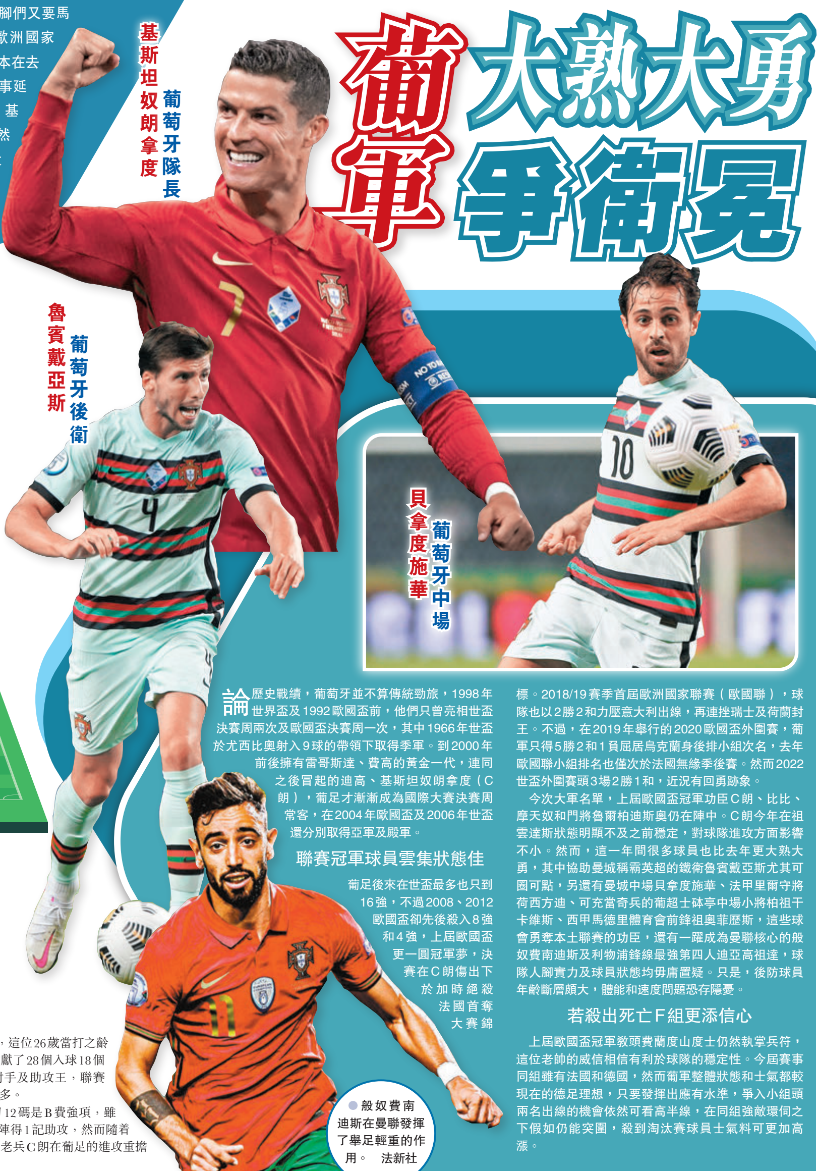
基斯坦奴朗拿度 葡萄牙隊長

核心。2020/21賽季，這位26歲當打之齡的好波之人為曼聯貢獻了28個入球18個助攻，成為隊中神射手及助攻王，聯賽助攻數位列英超第二多。 傳球、遠射、操刀12碼是B費強項，雖然去年歐國盃6次上陣得1記助攻，然而隨着實力上整體的進步，老兵C朗在葡足的進攻重擔料可得到明顯減輕。