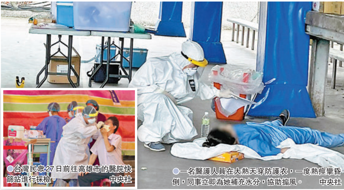
●台灣民眾27日前往高雄市的醫院快篩站進行採檢。