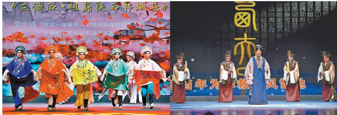
●演員表演秦腔《三滴血·祖籍陝西韓城縣》。 ●演員表演秦腔《關西夫子·天地有知明鏡懸》。