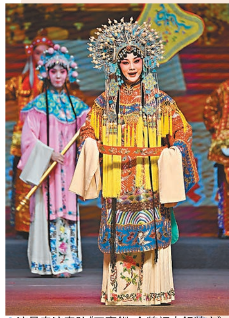
●演員表演秦腔《王寶釧·金牌調來銀牌宣》。

2021年中國秦腔優秀劇目會演昨日閉幕,活動期間20多位中國戲劇梅花獎名角在西安連連登場,獻上共14台28場的秦腔大戲和秦腔折子戲,集中展示了近年來我國秦腔藝術的優秀成果。今年中國秦腔優秀劇目會演以「慶百年華誕 創秦腔輝煌」為主題,包括秦腔展演、秦腔論壇、秦腔惠民和秦腔嘉年華四個板塊共20多項活動。展演精選了來自西北5省(區)的秦腔大戲和秦腔折子戲,其中反映鄉村振興、致敬時代楷模、傳承紅色基因、讚美邊疆建設的現實題材劇目佔60%。與展演同步進行的「一劇一評」活動,也推動評論與創作結合,引導文藝創作健康發展。惠民演出和秦腔文化體驗活動讓秦腔走進公眾生活,營造處處有戲、處處精彩的文化氛圍。