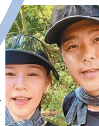
●翠如感謝老公這個陪跑男的支持。

了我的伴讀之友。我總是覺得我性格的缺陷,或多或少和我害怕(討厭)運動有關,我很易懦弱,怕事、不堅持、自卑,這些都不是做運動員應有的性格,更不是做演藝行業應有的特質。終於,我開始了,每天的0700晨早跑步,練體能,更要練意志。開始不難,堅持不易,願想透過跑步而令自己進步的你們和我們,一起加油。」而翠如已經連續跑了十天,每天06起床、07跑步、08吃早飯,她感謝老公這個陪跑男伴在她身邊的支持。