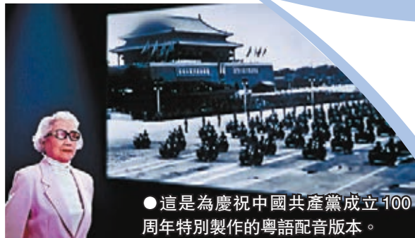
●這是為慶祝中國共產黨成立100周年特別製作的粵語配音版本。