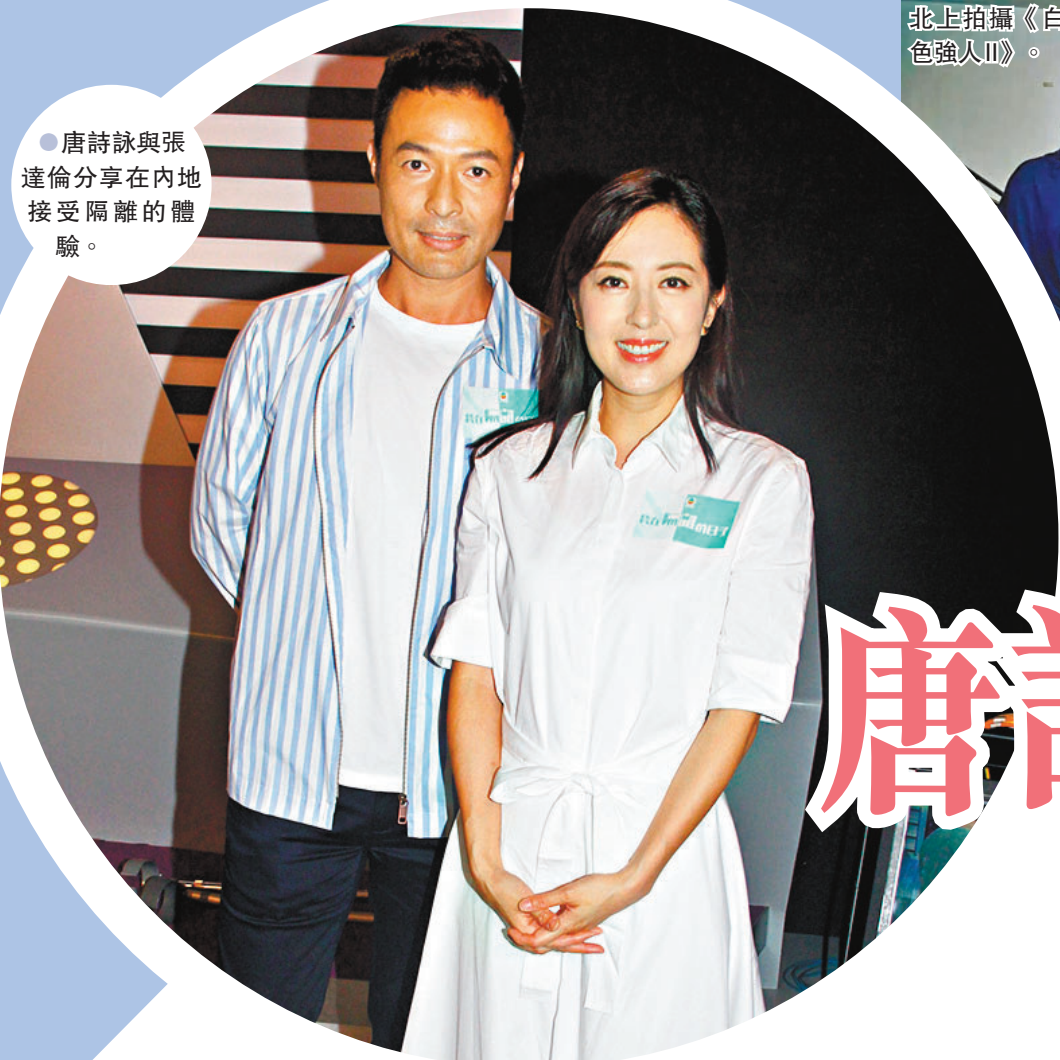
●唐詩詠早前北上拍攝《白色強人II》。