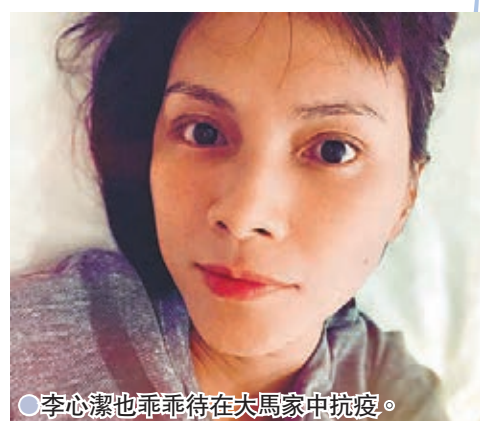
●李心潔也乖乖待在大馬家中抗疫。