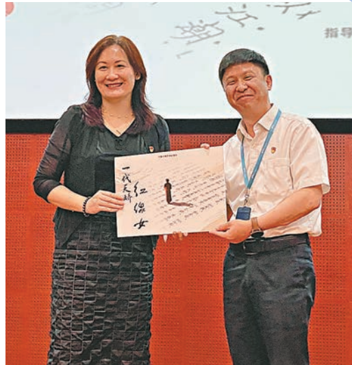
●10集人文藝術紀錄片《一代天嬌——紅線女》由出品方紅線女藝術中心贈予廣州圖書館收入館藏。