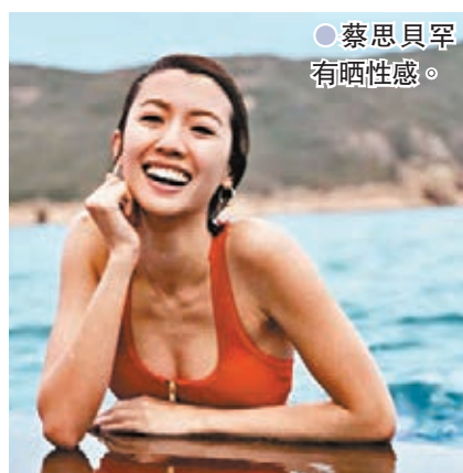
●蔡思貝罕有晒性感。