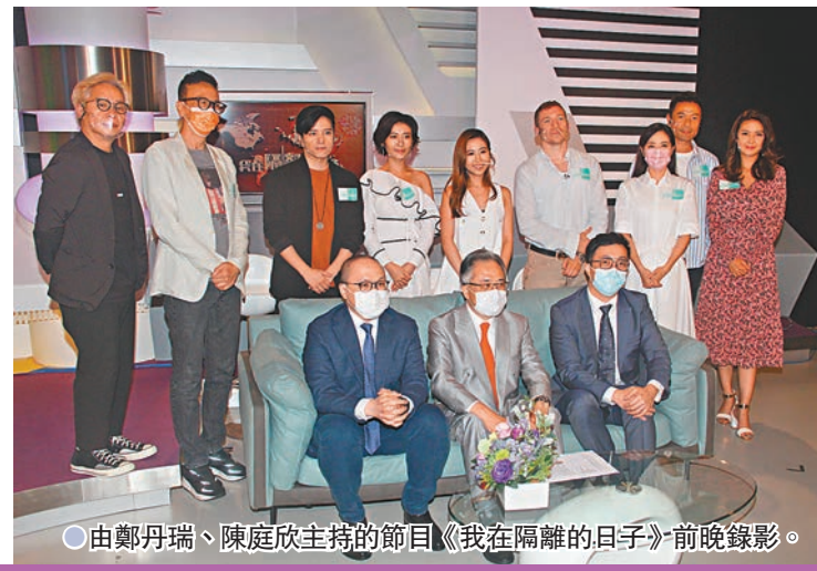
●由鄭丹瑞、陳庭欣主持的節目《我在隔離的日子》前晚錄影。