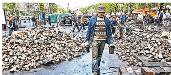
●烏克蘭經濟急速下滑。網上圖片

英國《衛報》分析指出，今次白俄「客機迫降」事件，給予西方國家針對白俄的藉口，而歐美各國使出「利誘」、禁止航班入境，以及後續各項經濟制裁等措施，便是對白俄軟硬兼施，最終企圖實現政權更迭，將白俄納入自身勢力版圖。 ●綜合報道